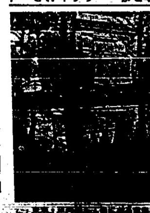
「ロマンチックな」... 本人の心を捉へて... 大層「ロマンチック」... 三浦洋子「ロマンチック」... 三浦洋子「ロマンチック」...