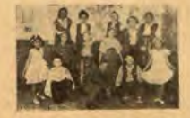
Участниците в пиесата „Добро сърце“ М. Ч. К. — у-ще „П. Р. Славейков“ — Варна

Интересна забава на празника на Младешкия Червен Кръст са предста-