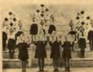
Балет на червенкръстци от у-ще „Санта Мариа“ — Русе

селото — с аптека, здравни съвети и милосърдна тежн младежи, сие деца, са били над всеки страдани и немощен от ролното им село. Те и техната организация достойно заслужават уважението им уважение.