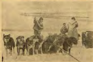
Разтоварване на пристигнали самолет, донесъл хранителни припаси за полярната станция.

Пребивайки около 16 часа във въздуха, ние в дълбока нощ се спуснахме в Чокурдах — поселище на брега на река Индигирка, на сто и петдесет километра от нейното устие в Източносибирско море. Тук в северна Якутия, е установена станция на Главния северен морски път, основното назначение на която е да осигурява радиовръзката и да съобщава данните за времето на намиращите се във въздуха самолети, да ги снабдява с гориво, когато те спират тук, да дава убежище и храна на екипажите и пасажерите. Едновременно колективът провежда и всичките научни наблюдения, които се възлагат на всяка полярна станция.