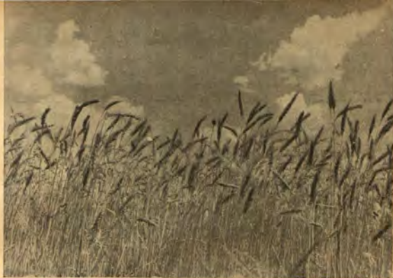
Тожкия плод на българската земя