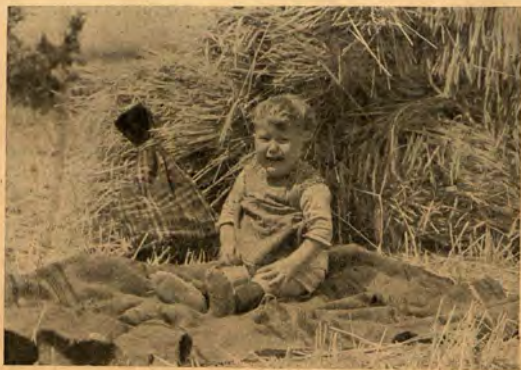
И той е с всички на „работа“ в полето

Относно предпазването на по-голямите деца от стомашно-червни разстройства трябва да се обърне особено внимание на условията на живот и на здравата просвета. Децата трябва да се приучват към добри здравни навици, да си мият ръцете и да не ядат зелени и замърсени плодове. Това се постига най-добре, когато през летните месеци децата се събират в детски градини, където под ръководството на възпитателки се приучват към редовен живот и добри здравни навици. Така подрастващото поколение ще се развива правилно, ще боледува по-малко и ще създава по-малко грижи на родители и общество.