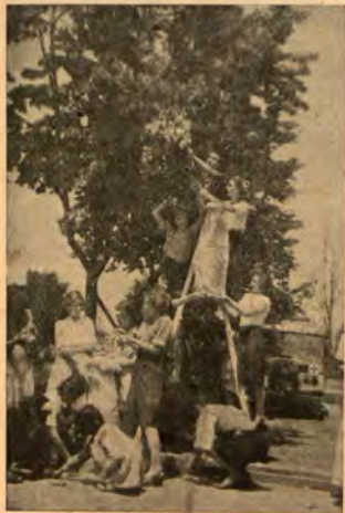
Червенокръсти събират липов цвят