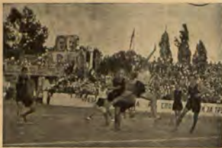
Интересен момент от играта „Шурм“

реч нупустне игрицето по каквато и да е причина. Отбор, останал с по-малко от 10 души не може да продължава играта и губи с 6:0. Ъгловият удар (корнер), аут, тач, дупса са заемствувания изцяло от футбола. Биенето им става, обаче, само с ръка.