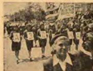
1 май — манифестация на русенските червенокръсти