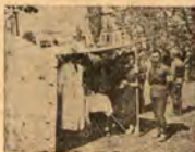
Пункт за даване първа помощ на БМЧК — Русе

По настояване на учениците бяха уредени курсове по бактериология, во-