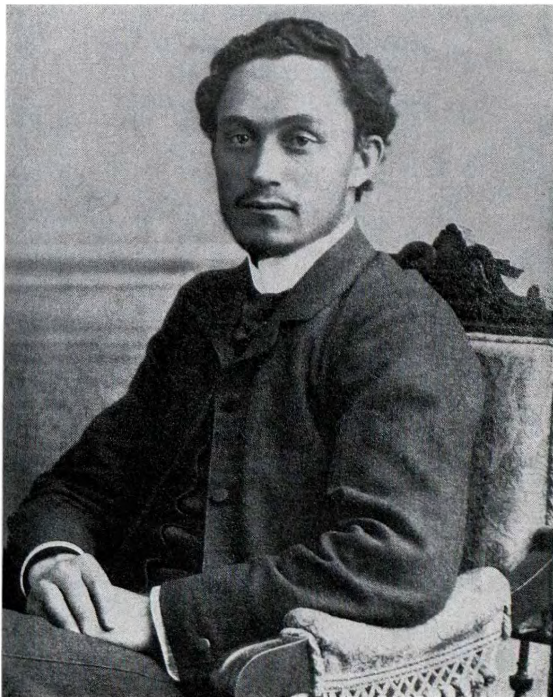
Георги Димитров 1905