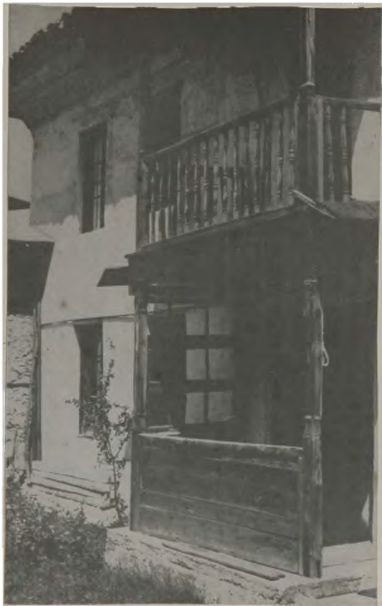
Къщата на Везюви в Банско, където в стаята на горния етаж, вляво, се ражда Н. Вапцаров