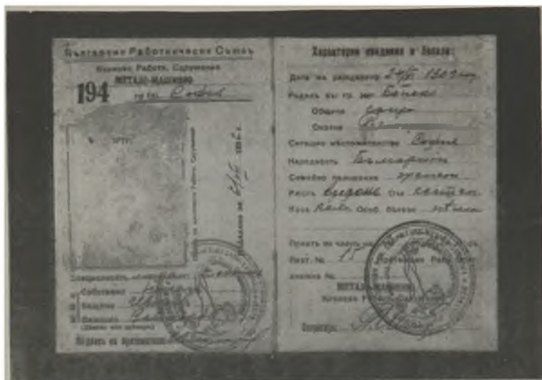
Членска карта на Н. Вапцаров от Българския работнически съюз, издадена в София през 1936 г.