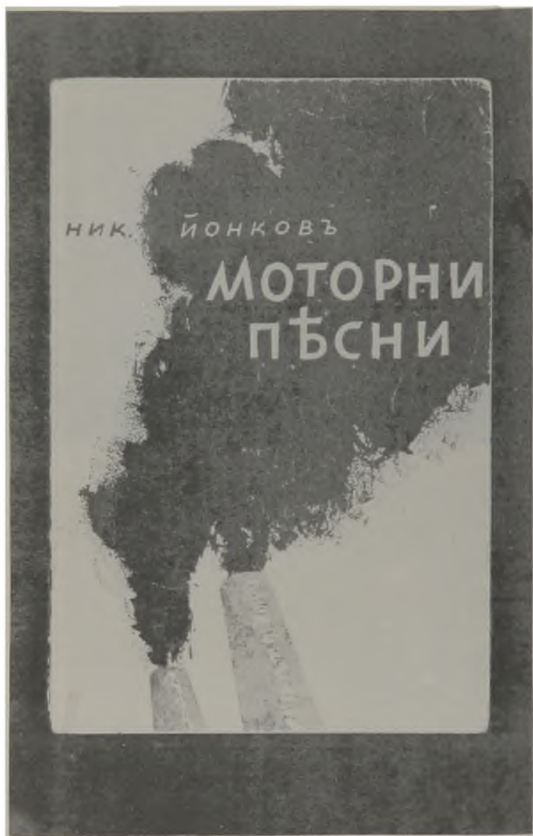
Корицата на първото издание на книгата «Моторни песни» през 1940 г., нарисувана от Б. Ангелушев