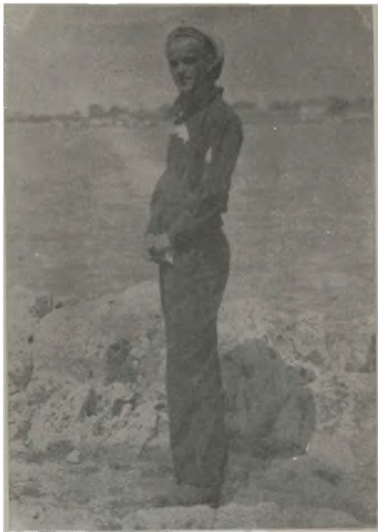
Моряка на черноморския бряг, 1929 г.