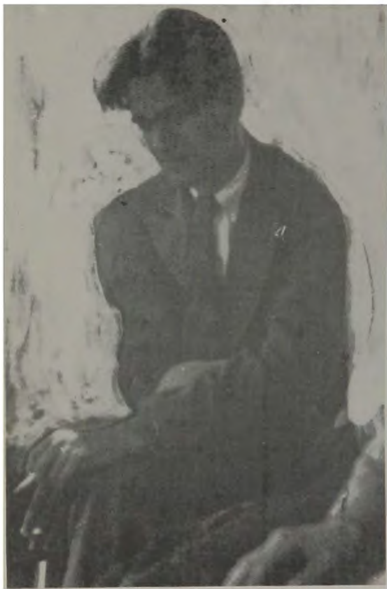
Една от най-изразителните снимки на поета от 1932 г.