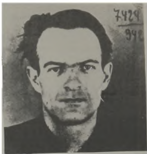
Последната снимка на поета, направена през март 1942 г. в Дирекцията на полицията