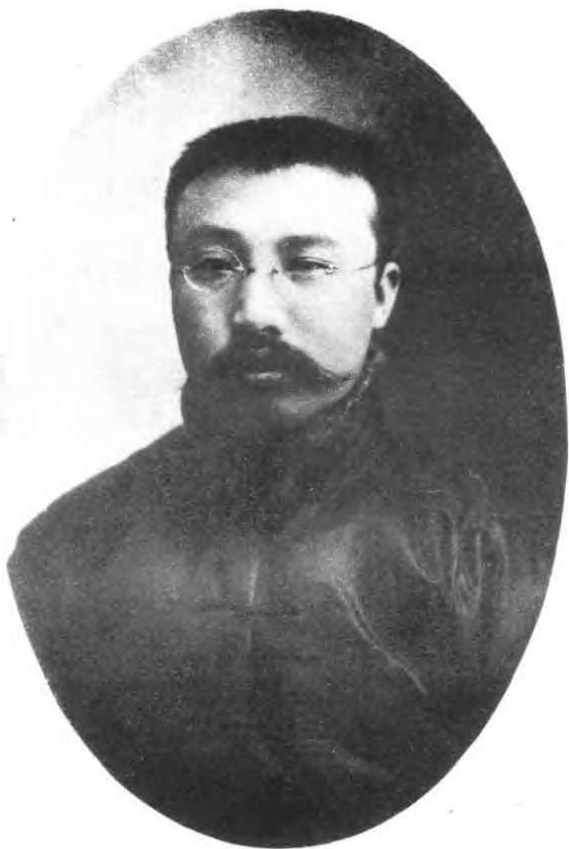
建党时期的李大钊