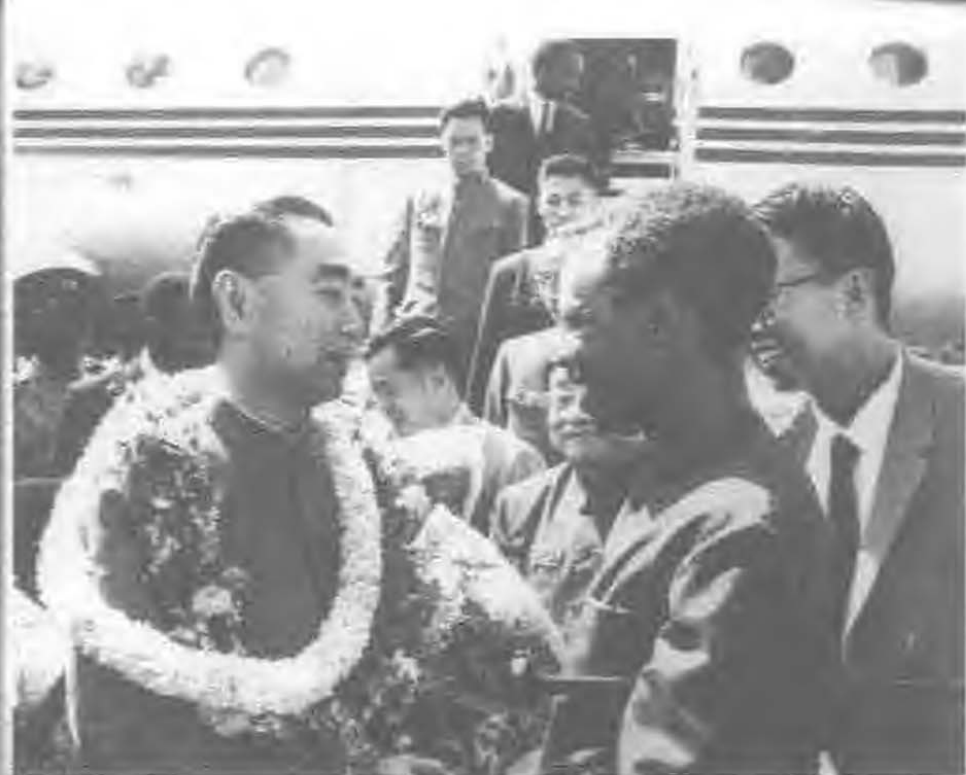
1965年6月，周恩来访问坦桑尼亚，在机场同尼雷尔总统亲切交谈。