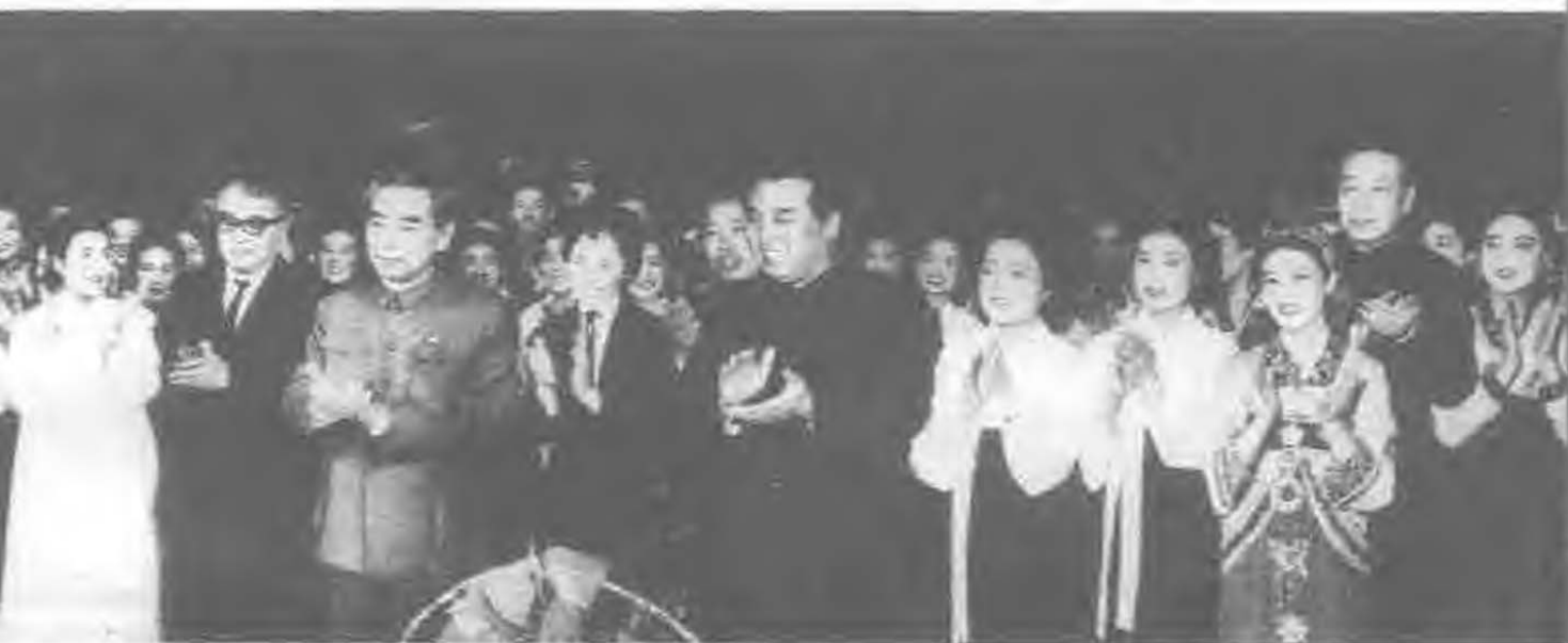
1970年4月，周恩来访问朝鲜，与金日成同志一起观看歌舞演出后，同演员合影。