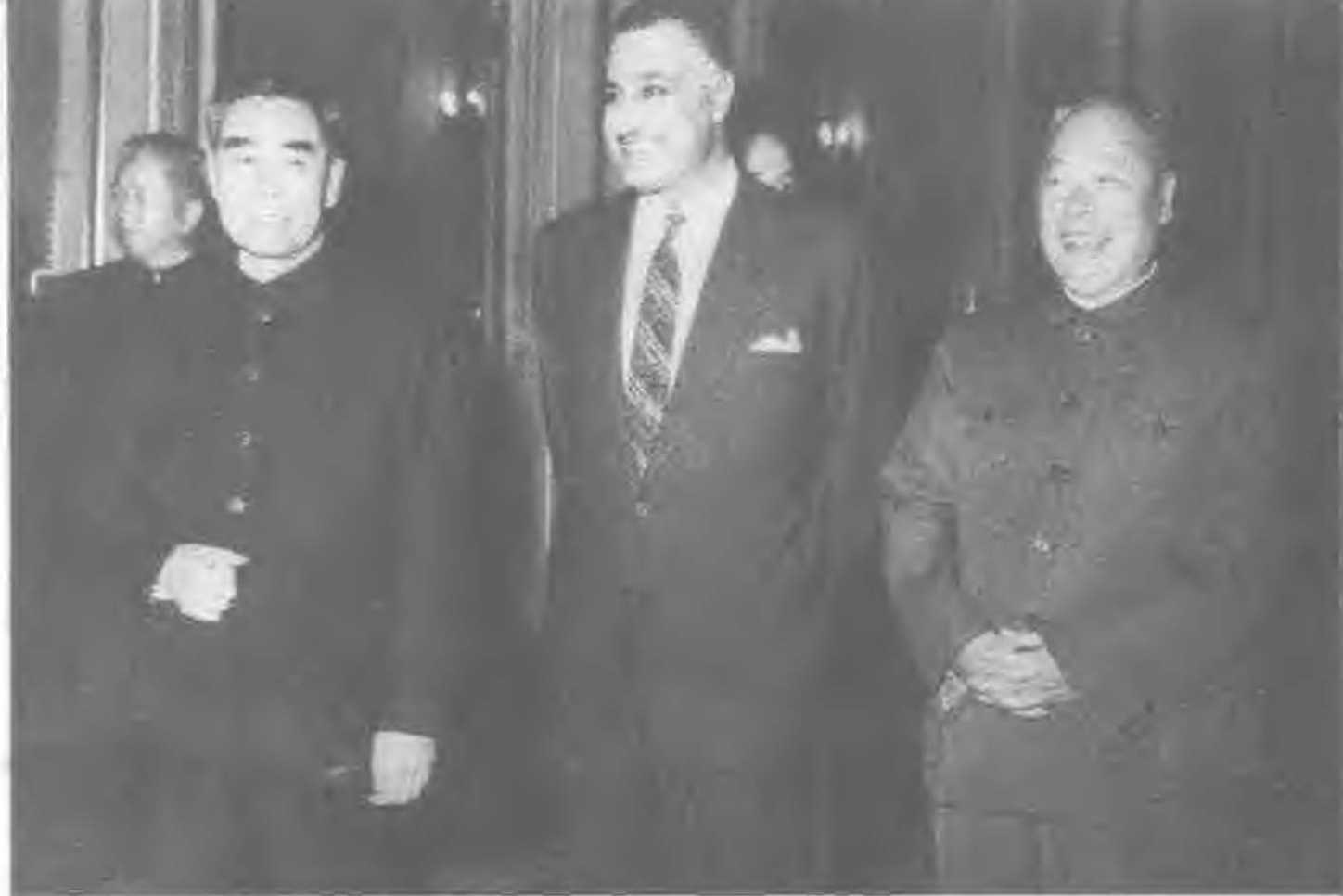
1963年底至1964年初，周恩来出访非洲10国，给“觉醒的大陆”带去中国人民的友谊。在埃及，他宣布并阐述了中同非洲、阿拉伯国家关系的五项原则，图为周恩来同纳赛尔总统在一起。