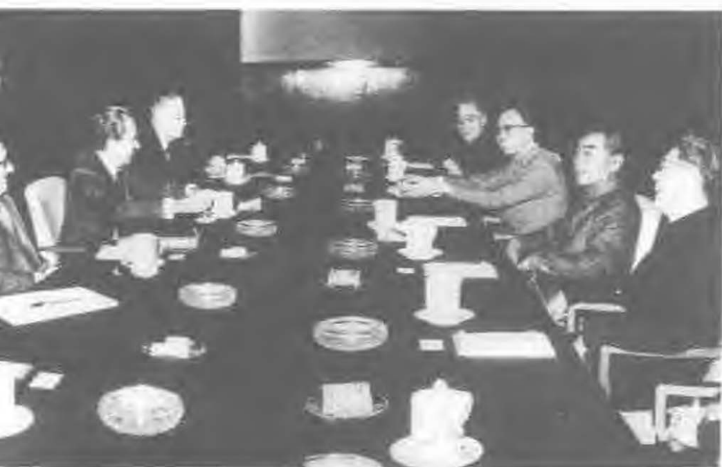
1972年2月， 周恩来同美国 总统尼克松会 谈。会谈后签 署上海公报， 打开了中美关 系的大门。