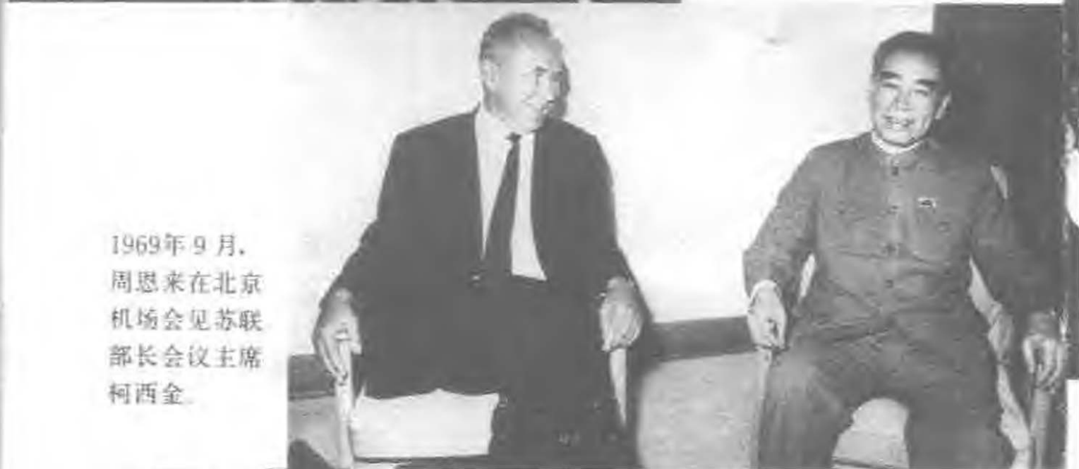
1969年9月，周恩来在北京机场会见苏联部长会议主席柯西金。