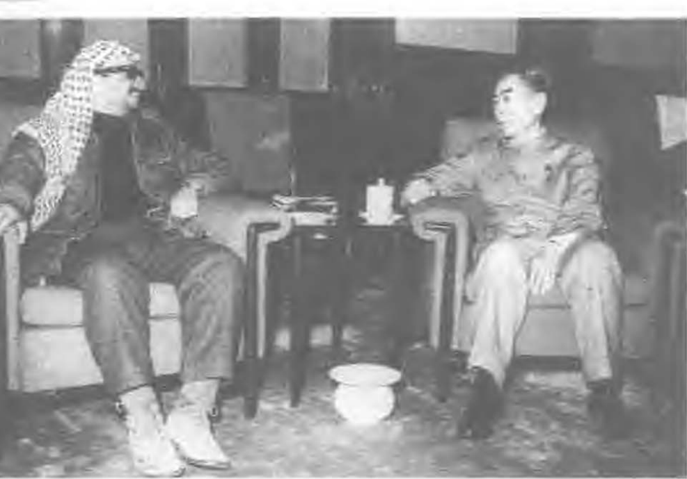
1970年3月， 周恩来在北京 会见巴勒斯坦 解放组织执委 会主席阿拉法 特。