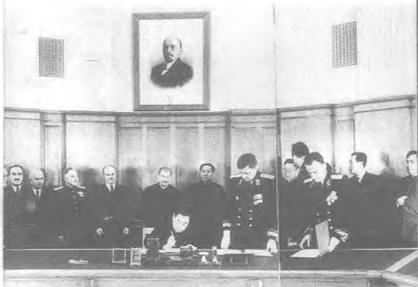
1950年2月14日，周恩来在中苏友好同盟互助条约上签字。