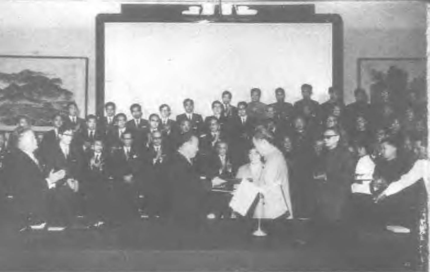
1972年9月29日，周恩来同日本田中角荣总理大臣在北京签署中日建交的联合声明。