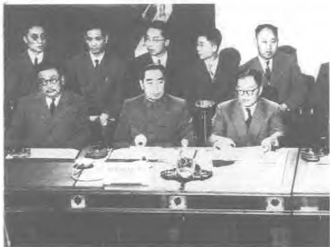
在1954年日内瓦会议上，周恩来率领中国代表团为朝鲜问题的政治解决尽了最大努力，为恢复印度支那和平作出了重要贡献。