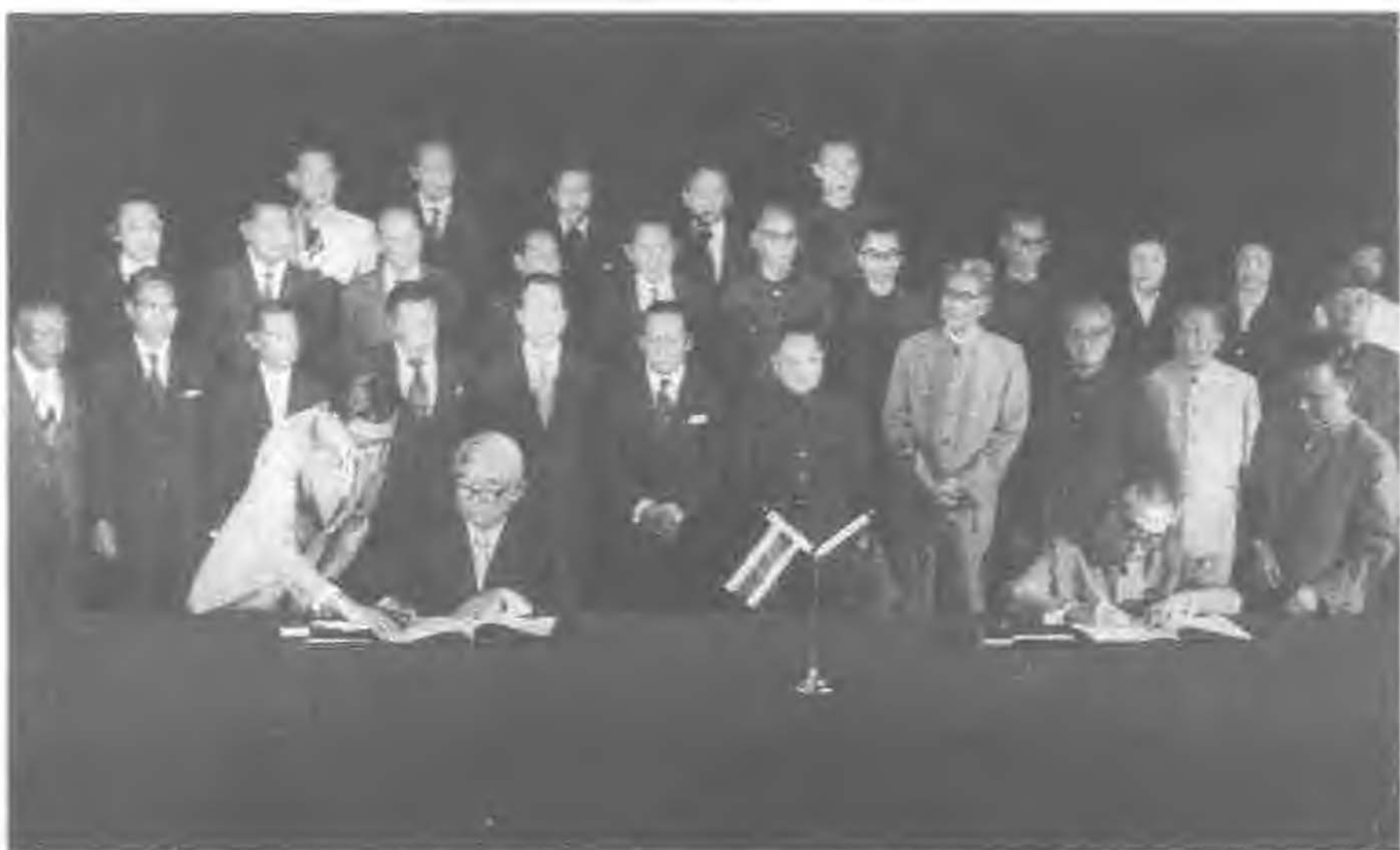
1975年7月1日，周恩来抱病在医院同泰国总理克立·巴莫亲王签署两国建交公报。