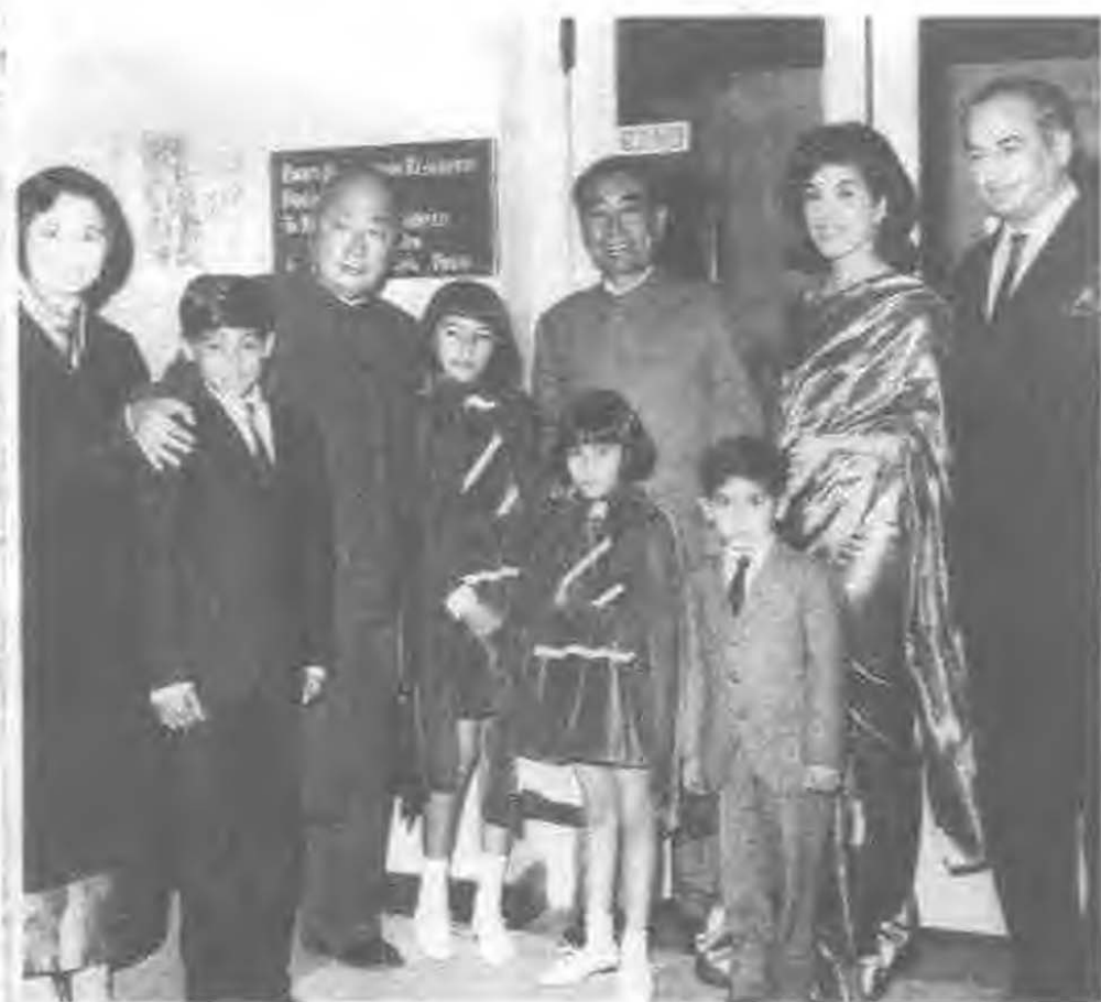
1964年2月，周恩来访问巴基斯坦时，同布托外长全家合影。（周右边的女孩为巴现任总理贝·布托，时年11岁）