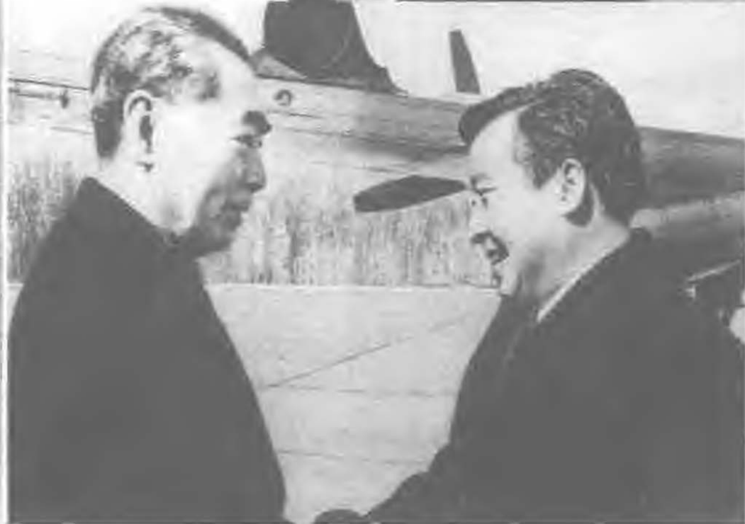
1970年3月，周恩来在北京机场迎接柬埔寨国家元首西哈努克亲王，对柬埔寨人民反对美国干涉的斗争表示坚决的支持。