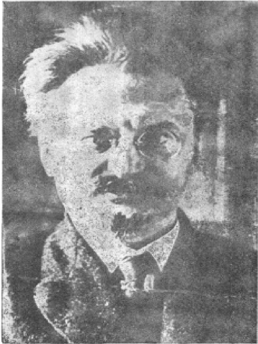
托洛茨基摄于1929年抵达土耳其海岛时