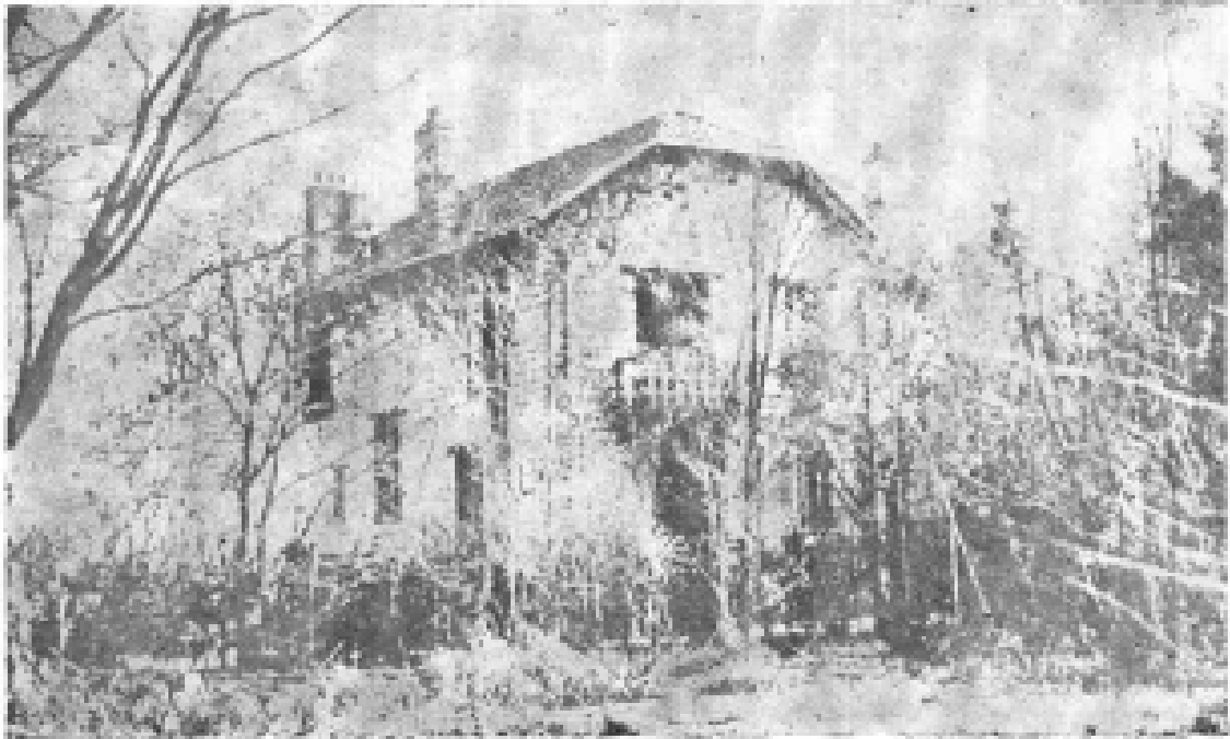
7. 在巴比仲的凯尔莫尼克别墅。