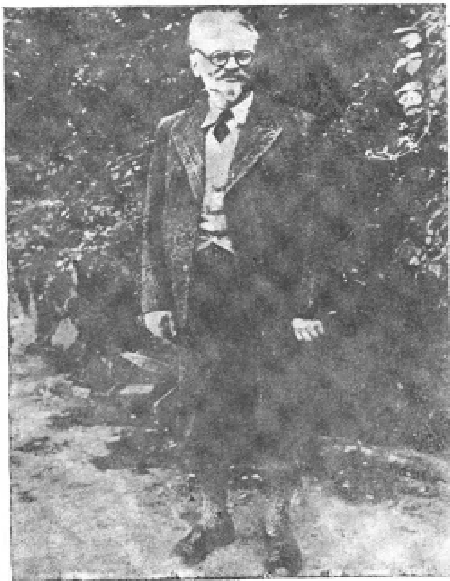
8. 托洛茨基在科约阿坎镇隆德雷斯街 的住宅庭院中留影， 摄于1937年1月