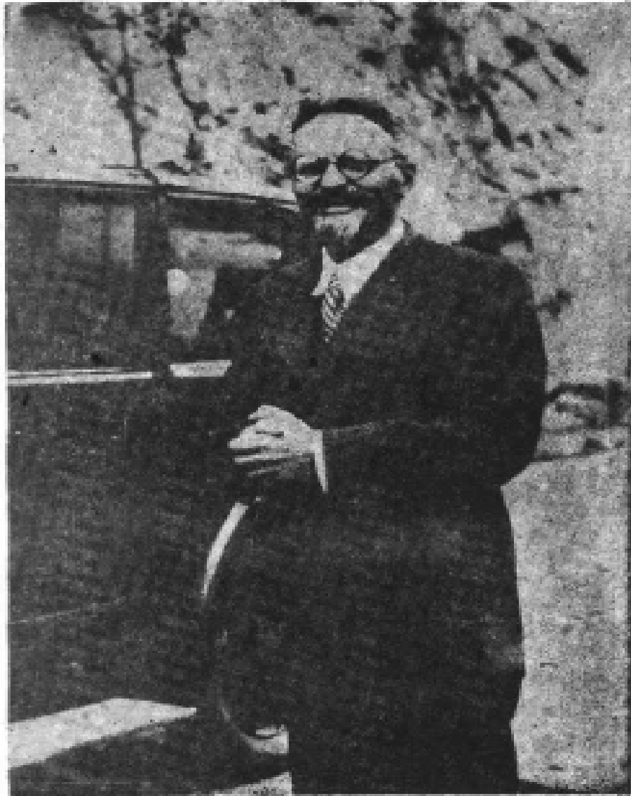
2. 托洛茨基赴哥本哈根途经法国马赛时留影， 摄于1932年11月21日