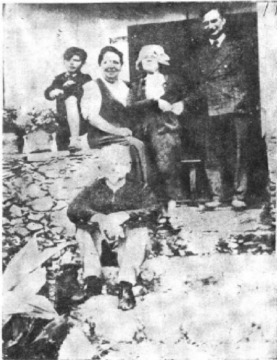
11. 谢瓦、玛格丽特·罗斯麦、娜塔丽娅、 阿尔弗雷德·罗斯麦和托洛茨基(坐在 石阶上的)合影, 摄于1939年8月