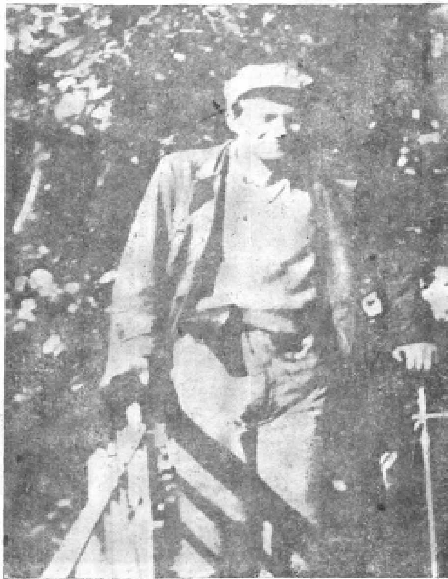
1. 本书作者让·范·埃热努尔摄于1933年春在 土耳其普林吉坡岛