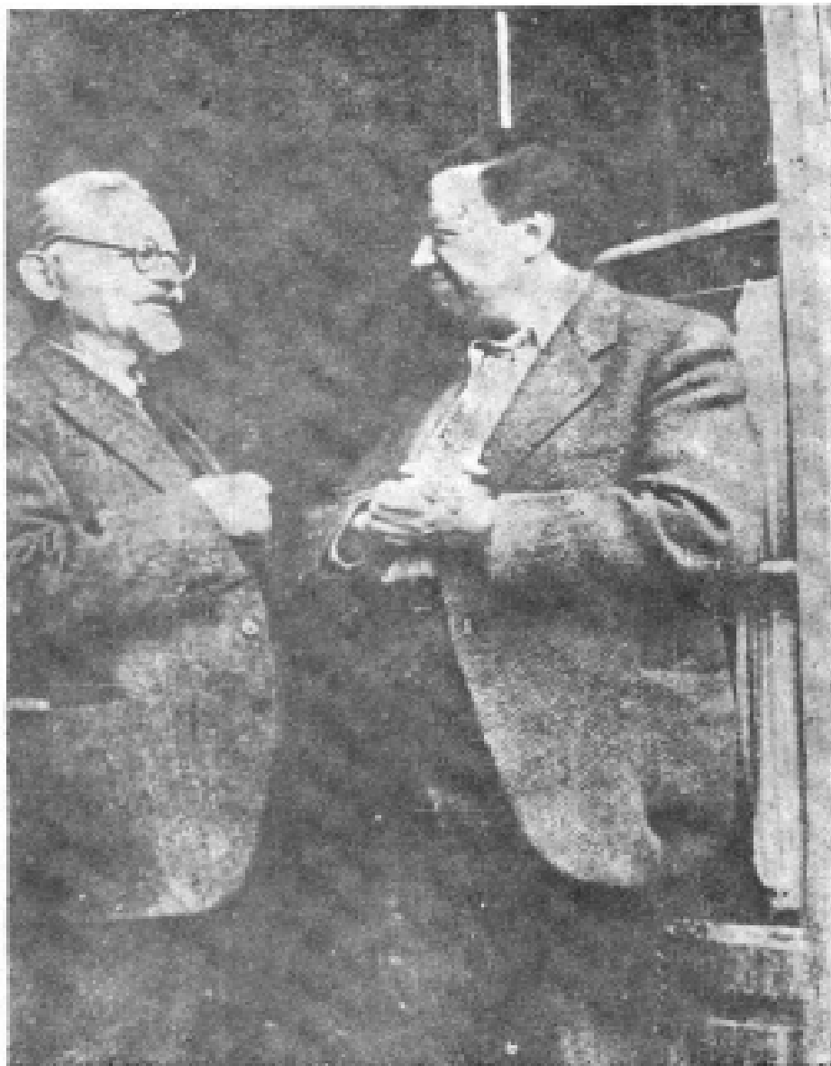
9. 托洛茨基与里维拉谈话时留影。