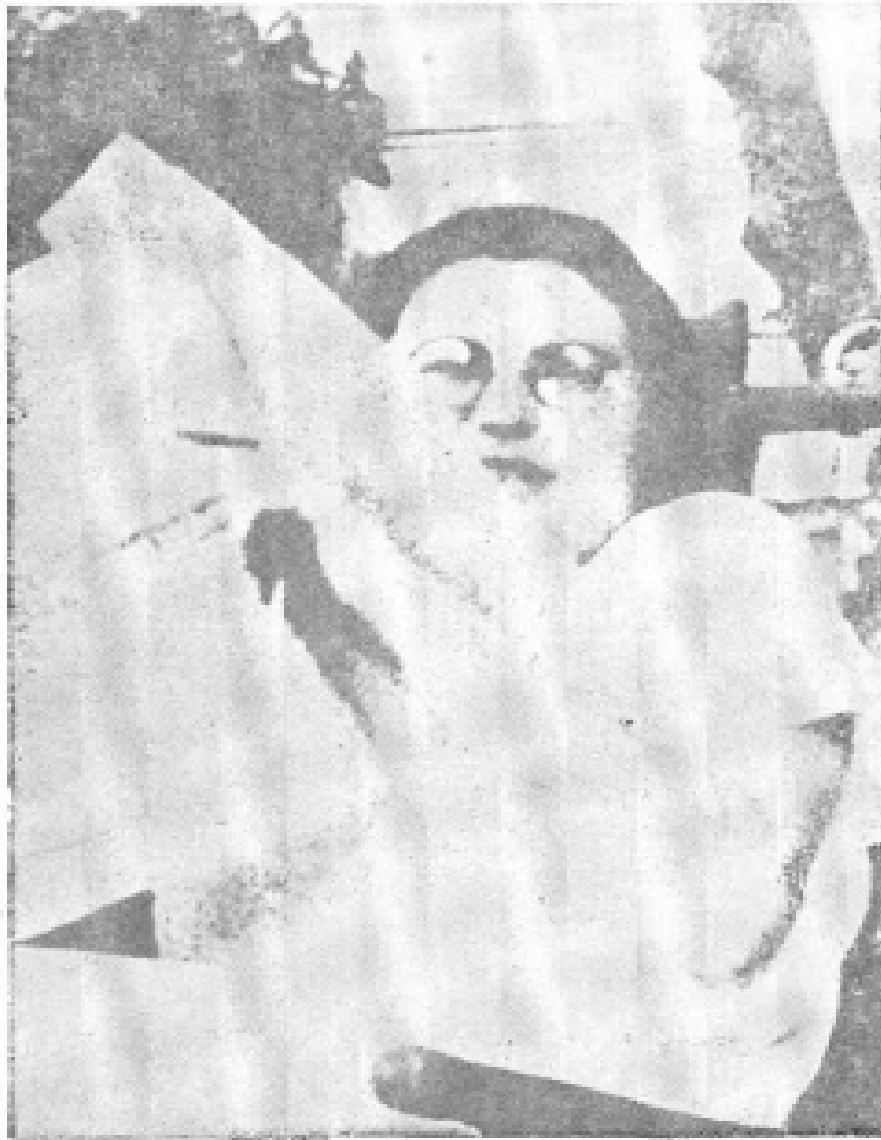
4. 托洛茨基的女儿齐娜于1931年留影