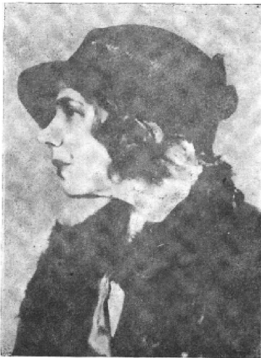
3. 托洛茨基的妻子娜塔丽娅于1929年 抵达土耳其时的留影