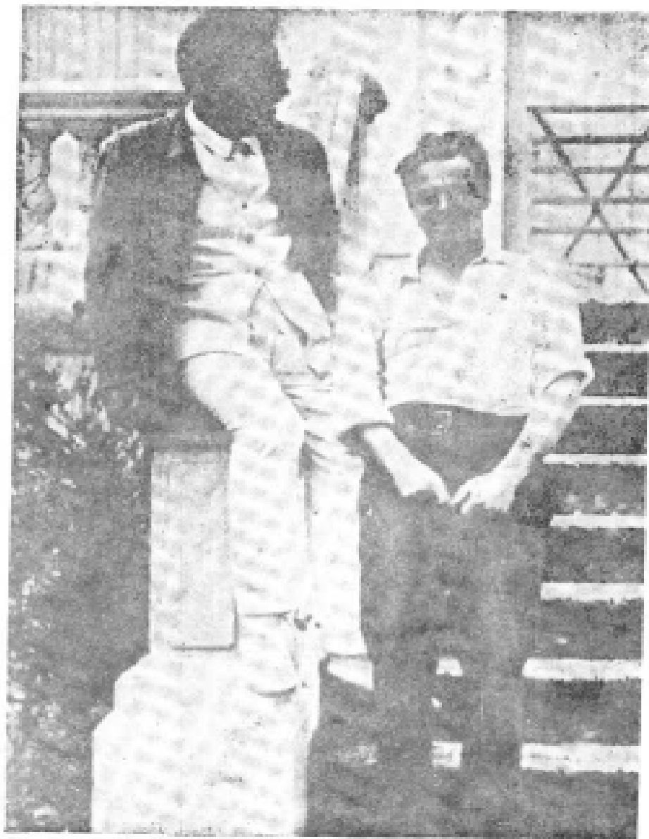
5. 托洛茨基和儿子廖瓦在圣帕莱留影， 摄于1933年8月