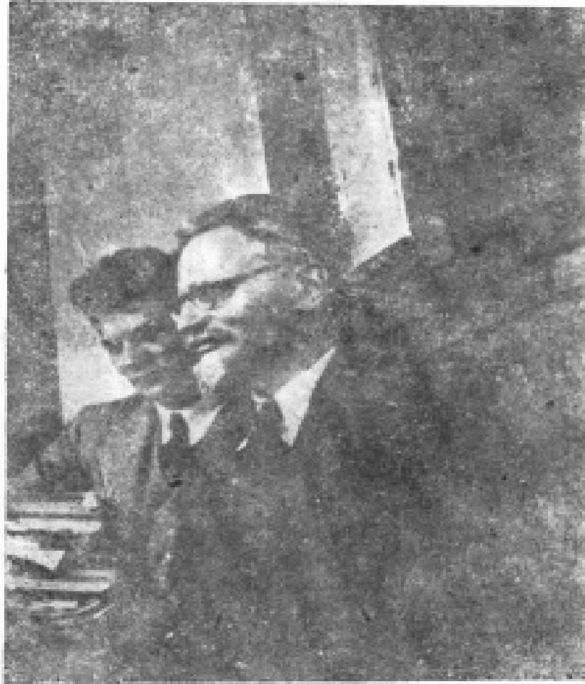
12. 本书作者让·范·埃热努尔跟托洛茨基出席 杜威委员会