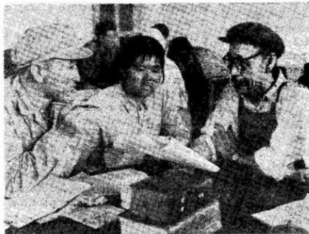
Los obreros de la Fábrica de Cables Eléctricos de Shen-yang, en el nordeste de China, junto con profesores y estudiantes de la Universidad de Liaoning, redactando notas a obras legistas escogidas.

EL puente Yang Lien-ti que atraviesa un profundo precipicio en las montañas de la provincia de Jonán, en la línea de ferrocarril desde Lienyunkang, una ciudad costera del mar Amarillo, hasta Urum-