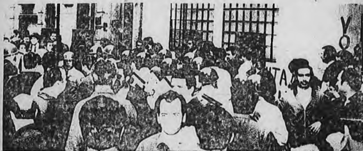
Cuando los obreros salían del local sindical donde se habían reunido en asamblea, manifestaron en alta voz su descontento.