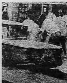
Compañeros del estudiante baleado lo ascienden a un auto para llevarlo al hospital.

Los acontecimientos de Corrientes y Rosario, con 2 compañeros estudiantiles miserablemente asesinados por la policía, han abierto un nuevo periodo de movilización entre el estudiantado, cuyo eje fundamental es la agitación contra la represión policial.