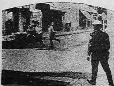
Durante los serios incidentes producidos en Rosario, un oficial de policía persigue a un estudiante, mientras le propina una seguidilla de garrotazos.