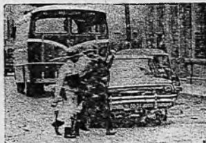
La calle ha quedado llena de escombros después de los disturbios, y la policía conduce detenido a un hombre.

fili, Resortes Argentina, etc. En esta labor se destacó, sin lugar a dudas, Vanguardia Metalúrgica, que venía de sindicalizar algunas fábricas desorganizadas. Esta presencia de Vanguardia Metalúrgica fue importante cuando hace una semana se discutió en el plenario de la UOM el curso a seguir, agravado por lo del sábado inglés. V.M. aprobó la actitud contemorizadora y vacilante de Simo (el secretario general) y con el apoyo de los mejores activistas se logró hacer aprobar por unanimidad el paro de 48 horas, que se efectivizó el jueves y viernes pasado.