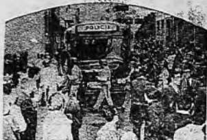
La guardia de infantería custodia este ómnibus para evitar que sufra destrozos como ocurrió con otros coches.

Los metalúrgicos, por otra parte, venían de la experiencia de exitosos paros por la derogación de las quitas zonales. En lo piquetes organizados para estos paros se produjo una importante articulación entre los activistas de Del Corral, Ro-