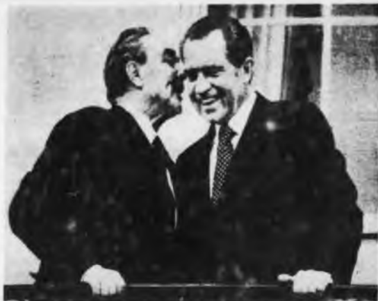
Brezhnev fue a pedir ayuda económica a Nixon.

Muchas informaciones han puesto de relieve la naturaleza de los problemas que el Kremlin se esfuerza por resolver: la Comunidad Económica Europea acaba de vender más de 200.000 toneladas de manteca a la Unión Soviética. Rockefeller volver de inaugurar en Moscú las oficinas del Chase