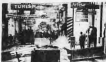
La provocación platense es la prolongación del ataque a la regional Salta.