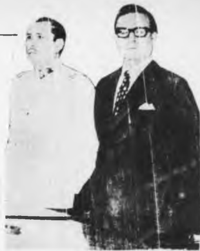
Allende y el militar Prats.

Vuelve a plantearse con claridad la verdadera naturaleza del gobierno de Allende. Se trata de una coalición de dirigentes contrarrevolucionarios del movimiento obrero con la burguesía, que busca derrotar pacífica y "organizadamente" al proletariado. Esta es la principal función del gobierno "obrero liberal" que preside Allende y que cada vez más queda tipificado como un go