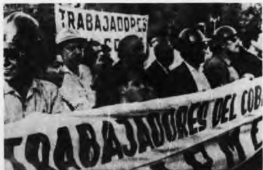
Allende organiza la derrota obrera.

Esta contradicción entre las ilusiones de las masas y la política contrarrevolucionaria de los partidos que la dirigen ha sido uno de los motivos por los cuales las masas han creado, desde abajo, organismos políticos regionales: los cordones industriales. Sin embargo, los partidos obreros se lanzaron a intervenir desde arriba en