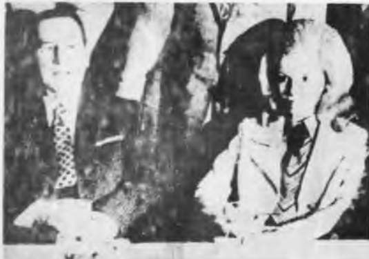
Perón e Isabelita la fórmula capitalista

7) Los plazos que tiene la burguesía argentina para estructurar una salida a fondo, sin embargo, son más bien cortos. La deuda externa ha llegado a la friolera de 7.500 millones de dólares y el déficit del presupuesto a 3 billones de pesos. El financiamiento de este monumental deterioro