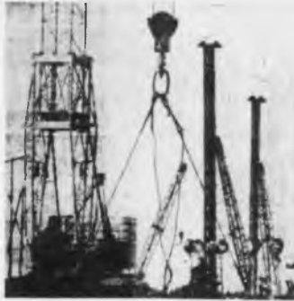
CONSTRUCCIONES para la instalación de la gigantesca fábrica de camiones que se levanta a orillas del río Kama, en la URSS. La planta producirá 750 mil vehículos de carga y 750 mil motores diésel por año. El Erntbank (organismo del gobierno de EE.UU.) y el Chase Manhattan Bank cooperaron en préstamo de 127 millones de dólares para el proyecto.

La pregunta planteada por Lenin: "¿Quién saldrá adelante?" es la relación de las fuerzas entre la URSS y el proletariado revolucionario del mundo, por una parte, y las fuerzas interiores hostiles y el capitalismo mundial por otra. Los éxitos económicos de la URSS le permiten afianzarse, progresar, armarse y si es preciso, batirse en retirada y esperar; en una palabra, mantenerse. Pero en sí misma la pregunta de Lenin se plantea ante la URSS no sólo en sentido militar sino en el sentido económico, a escala mundial. La intervención armada es peligrosa. La intervención de las mercaderías a bajo precio, siguiendo a los ejércitos capitalistas, sería mucho más peligrosa. La victoria del proletaria-