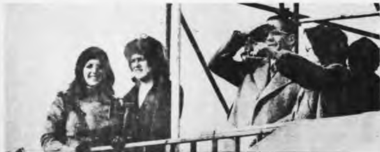
Bidegain (la "izquierda peronista") se sumó al paro.

La política de Bidegain y de la izquierda peronista es de encubrimiento de la derecha, como lo demuestra su apoyo al paro derechista que, en lo inmediato, estaba dirigido contra ellos mismos. No se trata de criticar tan solo los métodos -desmovilización- con que Bidegain se defiende de la derecha. Se trata, en cambio, de comprender que la ruptura de todo tipo de confianza política en Bidegain es condición ineludible para la lucha contra la derecha y para la existencia misma de una alternativa obrera independiente.