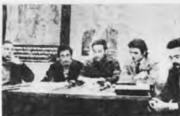
*La dirección de la Juventud Peronista