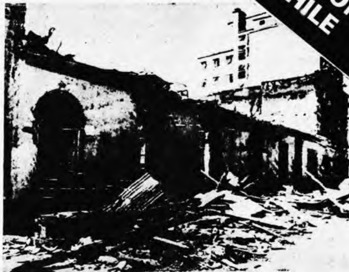
* Sede del Partido Socialista destruida.

La consigna de los soviets era la ruptura programática fundamental con el Frente Popular de la UP por la sencilla razón de que era un gobierno que se apoyaba electoralmente en el proletariado y los sectores populares pero que se o-