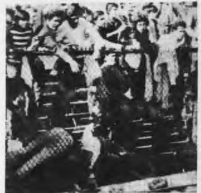
*Presos políticos en un estadio de Chile