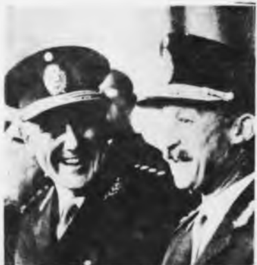
Lanusse y Onganía