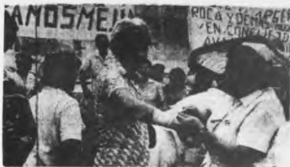
El incidente produjo cuatro heridos entre los manifestantes.