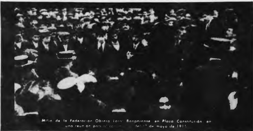
Mitín de la Federación Obrera Local Bonaerense en Plaza Constitución en una reunión para el congreso del 1º de mayo de 1915.

Así, hace 65 años, una huelga obrera hizo retroceder por primera vez al gobierno imponiendo las reivindicaciones de los trabajadores en la lucha por las libertades democráticas y sindicales. En esta tradición quiere ubicar POLITICA OBRERA su celebración del próximo 1o. de Mayo, Día Internacional de los Trabajadores, jornada de lucha por la independencia de clase del proletariado.