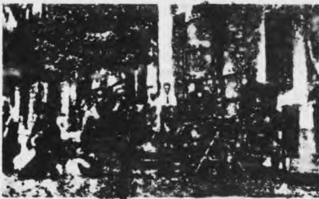
Reorganización contra huelguistas.