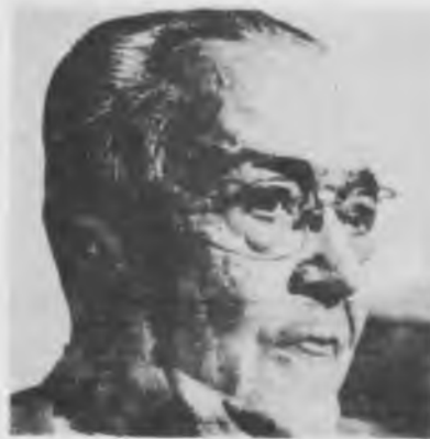
RICARDO BALBIN favoreció un acuerdo con la ultraderecha "ortodoxa"