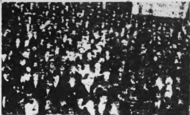
10 de mayo. Acto obrero a principios de siglo