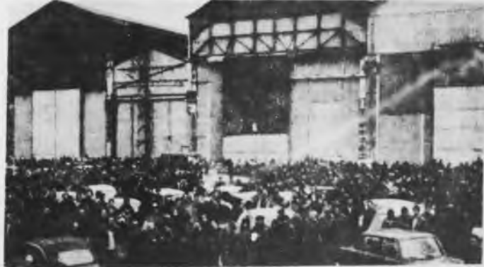
Mayo del 68 en Renault