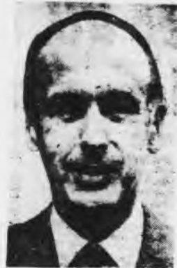
Valéry Giscard d'Estaing

La importancia de la huelga bancaria reside en que en ella se han combinado el desborde de los aparatos y la utilización de las organizaciones sindicales. En el transcurso de la huelga se desarrolló una permanente batalla política entre la masa de huelguistas y los apa-