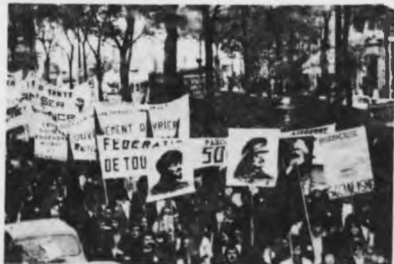
Movilización de la O.C.I.