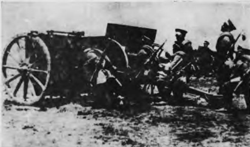
Guerra del Chaco: marcó la declinación definitiva de los regímenes oligárquicos y la aparición en la escena política del proletariado como clase dirigente.

Esta columna vertebral de su orientación