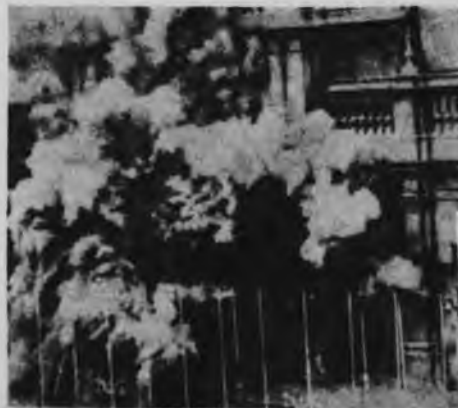
Setiembre de 1973

"De 1970 a 1973, el presupuesto de defensa nacional pasó de 1.119.700.000 a 7.340.063.000 escudos, lo que, teniendo en cuenta la inflación, representa un fuerte aumento" ( Le Monde , 20 de diciembre de 1973). "La asistencia del imperialismo a las FF.AA. fue enorme, y Allende gestionó la ayuda militar" ( The Economist Intelligence Unit ). "El programa de ayuda militar se a-