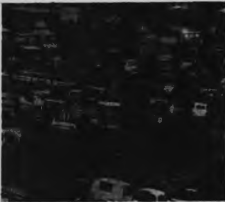
Huelga de "camioneros" Financiada por la reacción y la CIA para paralizar el país.

El ingreso de los militares al gobierno constituyó un golpe de fuerza de la burguesía, el imperialismo y de la U.P. contra las masas que comenzaban a movilizarse fuera de los límites que le marcaba el gobierno. En estas condiciones, el gobierno comenzará a aplicar los mecanismos directos de la contrarrevolución. Los militares en el gabinete eran un primer paso. ¿Las perspectivas? Un Krenski chileno apoyado en los Kornilovs chilenos. Es decir, el bonapartismo como primer paso de la contrarrevolución. ●