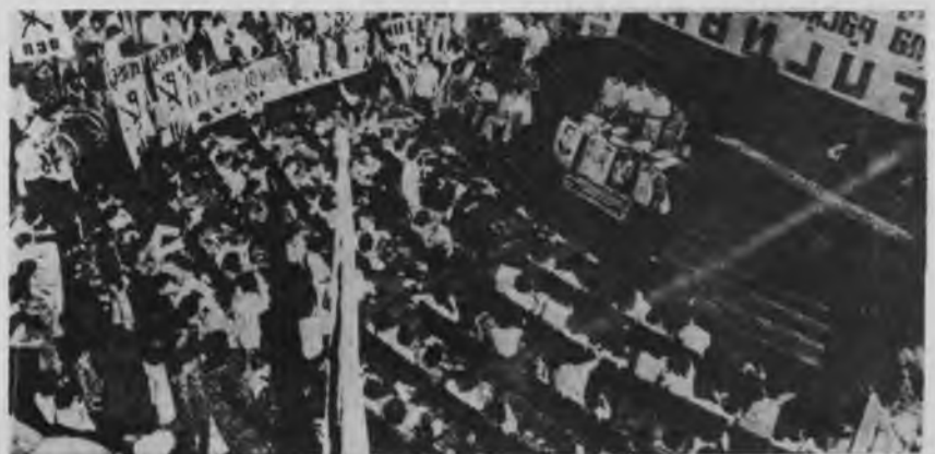
La FULNBA debe reclamar: Frente Unico de la FUA, CTERA, partidos y sindicatos

Un importante número de activistas y DELEGADOS de la Universidad de Bs.As., que durante el cierre se reúnen en Asociaciones Profesionales (Sociedad de Arquitectos, Federación de Psiquiatras) se encuentran en pleno debate sobre las razones que han conducido a la actual situación y las perspectivas abiertas. La conducta que mantiene la CTERA, la FUA y la FULNBA demuestran que la única conclusión posible de este debate es la que venimos desarrollando sistemáticamente desde estas páginas: la resistencia de masas y el frente unico para la defensa de nuestras conquistas exigen romper con el gobierno y la burguesía, reclaman la organización política independiente del movimiento estudiantil y docente. ●