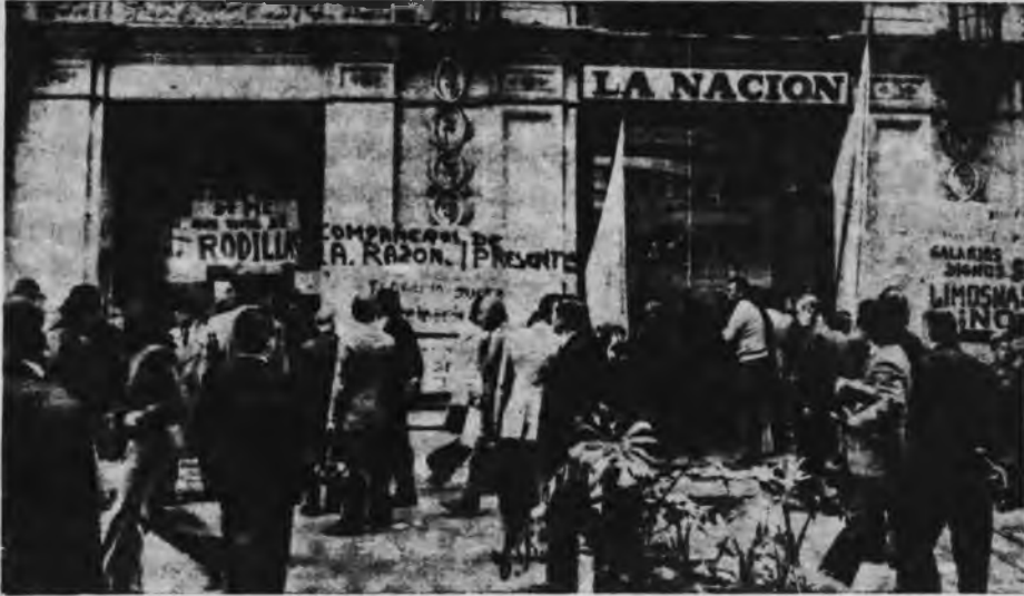
El gobierno pretende dejar fuera del mísero aumento a gráficos, periodistas, mecánicos, a las centenas de fábricas que lograron conquistas salariales

"en la nueva Argentina cada uno debe producir el doble de aquello que consume".