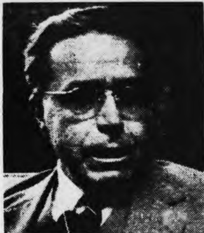
Víctor Paz Estenssoro. Jefe del MNR, abrió las puertas a la restauración contrarrevolucionaria de Barrientos en 1964.

La línea seguida por los liquidadores estaba en consonancia con la orientación dada por el secretariado de la IV Internacional,