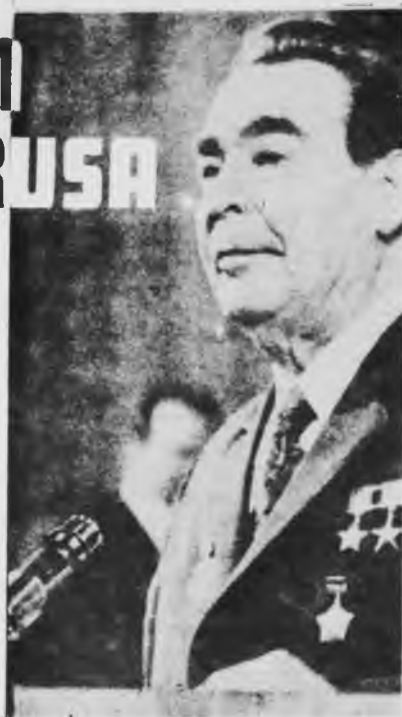
La burocracia rusa en el camino de la destrucción de las bases sociales del Estado Obrero.

Desde la finalización de la llamada "guerra fría", la burocracia rusa ha avanzado