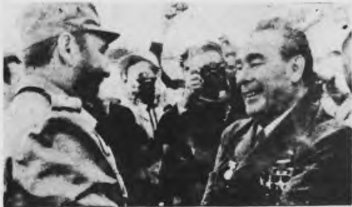
El gobierno castrista está comprometido con los acuerdos entre el imperialismo y la burocracia.

El otro aspecto de las discusiones son los compromisos militares del gobierno castrista con la burocracia rusa. El número y mencionado del Wall Street Journal señala: "La Unión Soviética teme que si la independencia de Cuba va demasiado lejos, termine experimentando un revés diplomático-militar como en Egipto, hace unos años, y en Yugos-