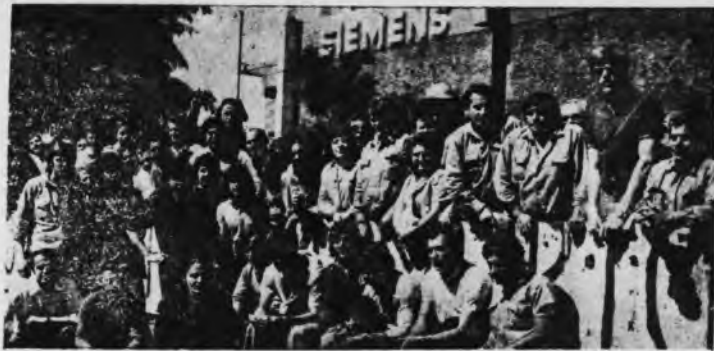
Obreros de la planta Panamericana de Siemens en huelga.