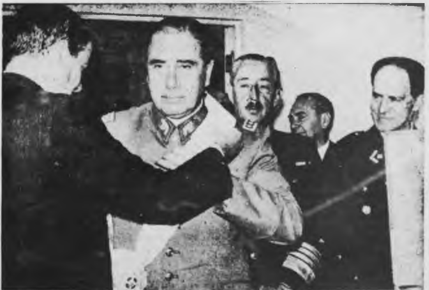
El gobierno peronista, por medio del Ministro de Defensa Savino, condecora al masacrador Pinochet. Los miembros de la Junta Merino y Leigh contemplan la ceremonia.

*Cese de las masacres y persecuciones. Libertad a todos los detenidos.