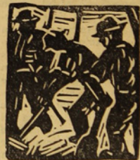
(De la 2.a página).