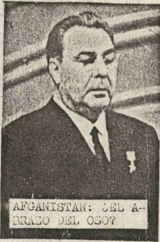
AFGANISTAN: DEL ABRAZO DEL OSO?

La Invasión Rusa a Afganistan constituye parte de la actual lucha antiperimperialista por redistribuirse áreas de influencia con el Imperialismo Norteamericano, en esta pugna interimperialista se da también la colusión cuando se trata de desviar del camino revolucionario a los pueblos.