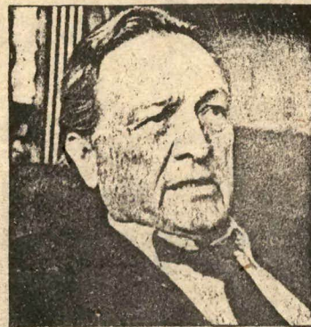
SILVA RUETE: "ULLOA SIGUE MI POLÍTICA ECONOMICA"