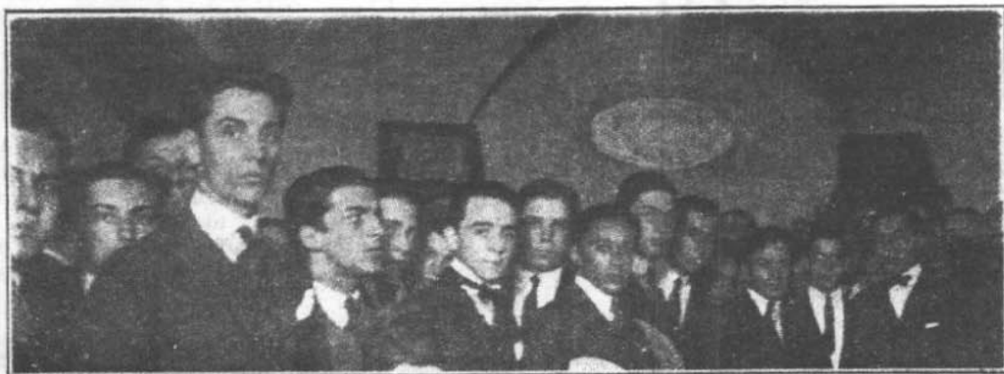
GRUPO DE ESTUDIANTES URUGUAYOS

Una comisión de The National Student Forum visita en estos momentos las universidades alemanas y estudia el maravilloso resurgimiento del nuevo espíritu revolucionario que en ellas se realiza.