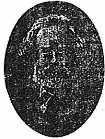
por Eliseo Reclus