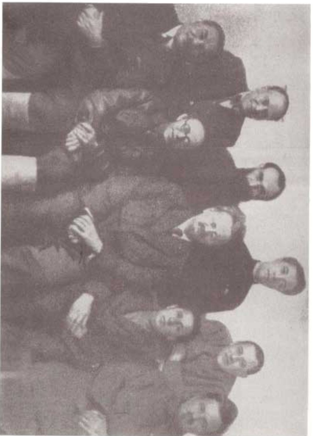
رهبران گروه مخالفان که در ۱۹۳۷ میلادی از حزب اخراج شدند