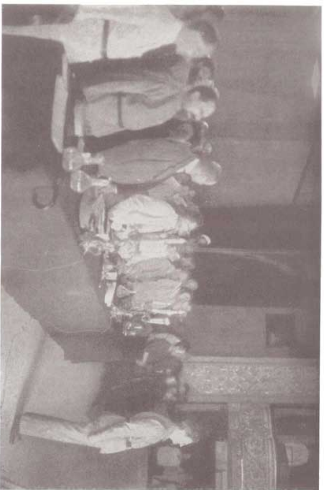
ترو تسکی در یکی از کنفره‌های بین‌الملل کمونیست