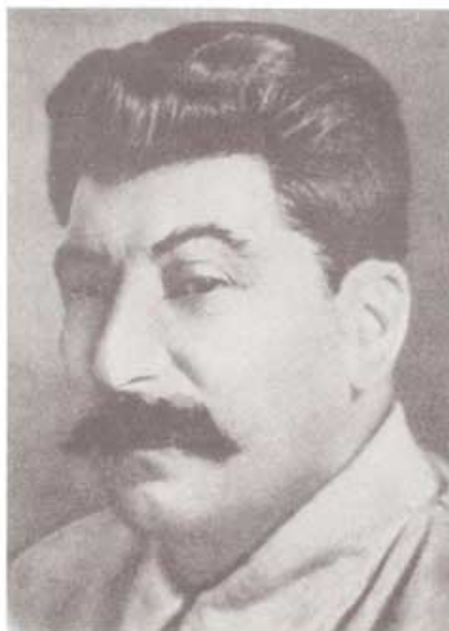
استالین، در سالهای توطئه و کشاکش برای پیروزی