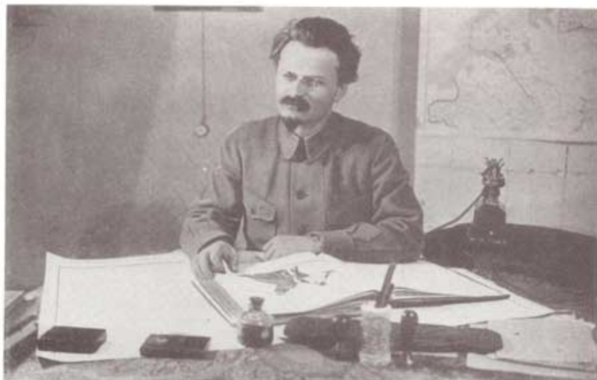
تروتسکی: کمیسر (وزیر) جنگ