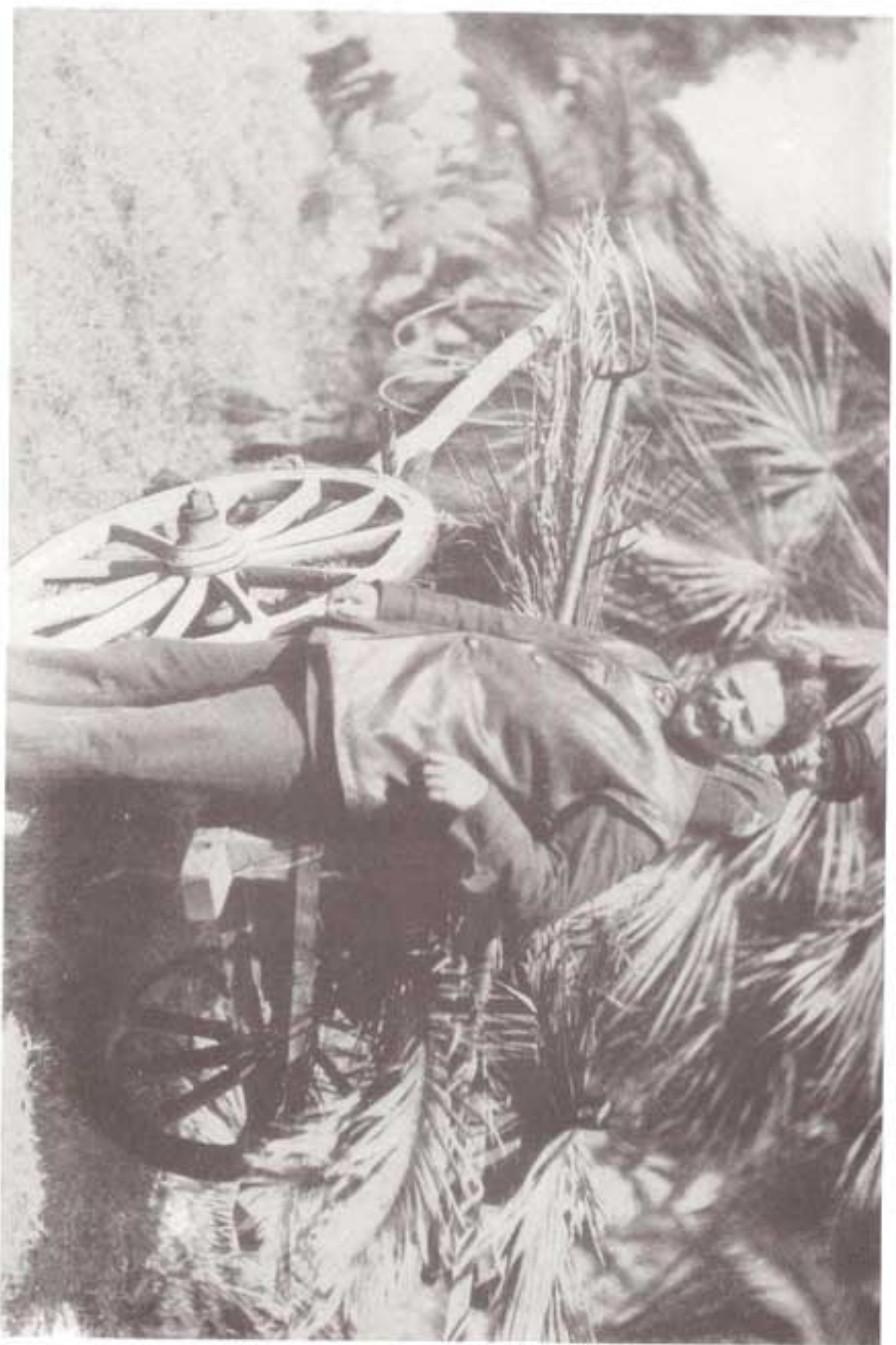
تروئسکی، ۱۹۲۴ میلادی، در ایام استراحت در قفقاز