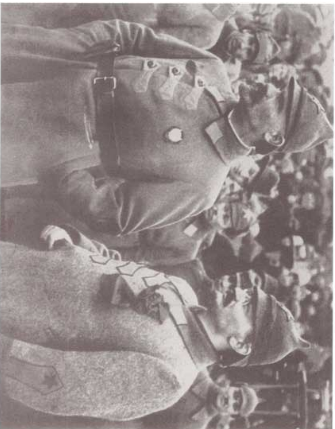
تروتسکی و مورالوف، فرمانده پادگان مسکو