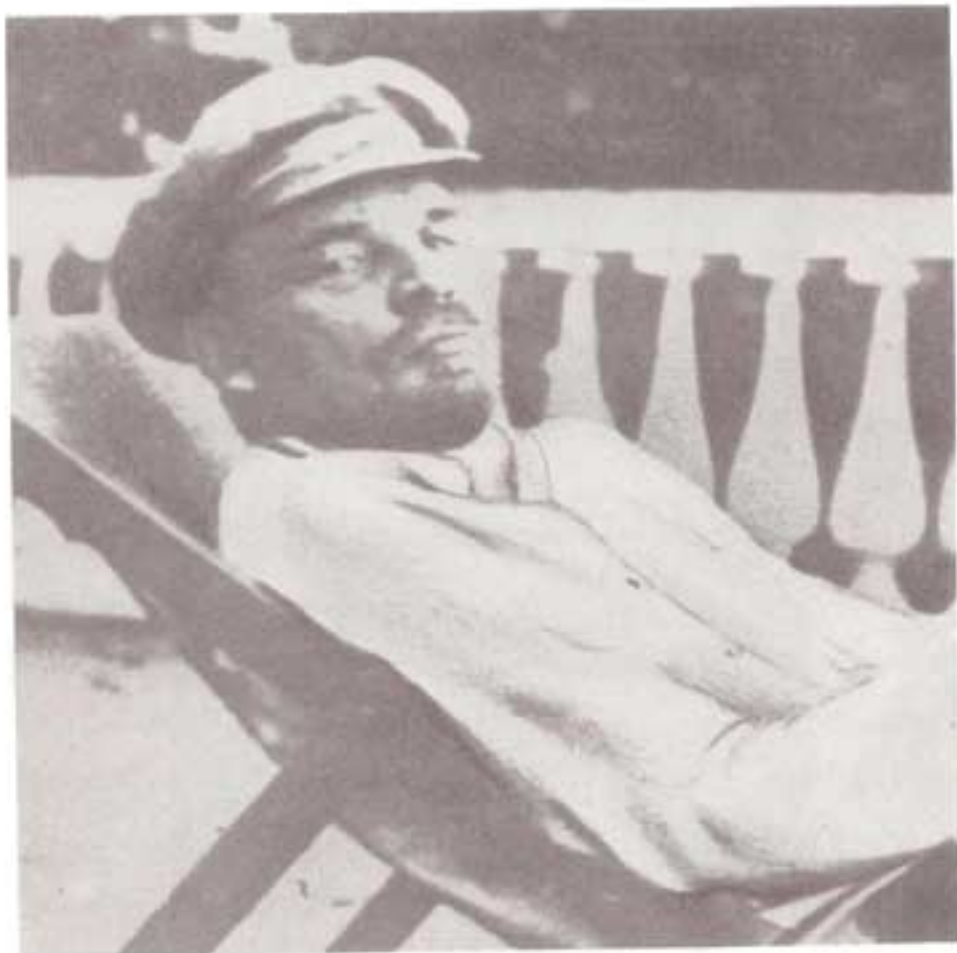
لنین، دوران نقاهت را می گذراند