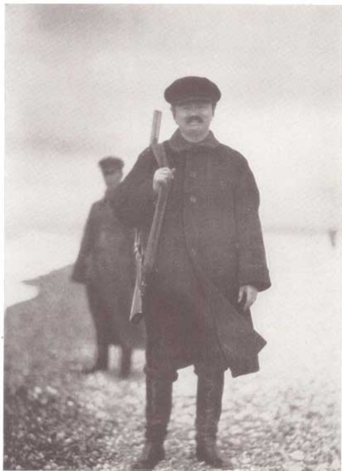
تروتسکی در تبعید