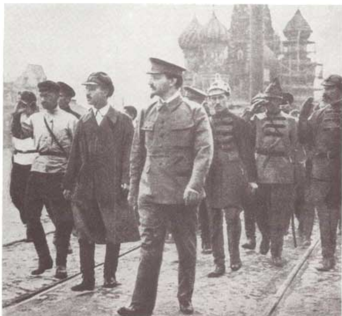
تروتسکی پس از جنگ میهنی: در مسکو از سپاه بازدید می کند