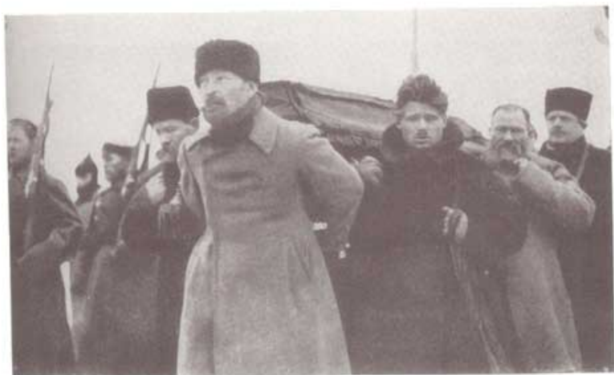
پیکر لنین که به مسکو آورده می شود؛ برای مراسم سوگواری