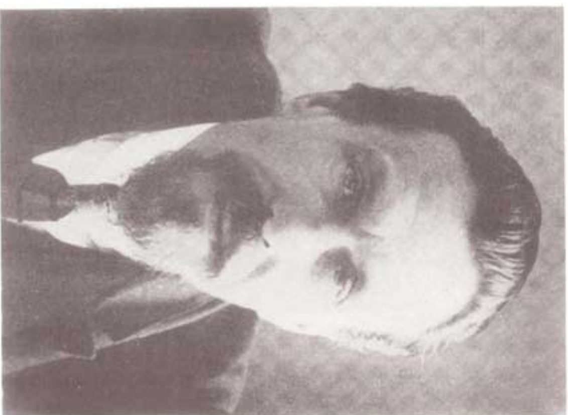
ریکوف، رئیس شورای عالی اقتصاد ملی