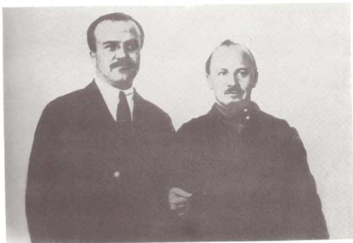
بوخارین و مولوتوف، ۱۹۲۱ یا ۱۹۲۲ میلادی