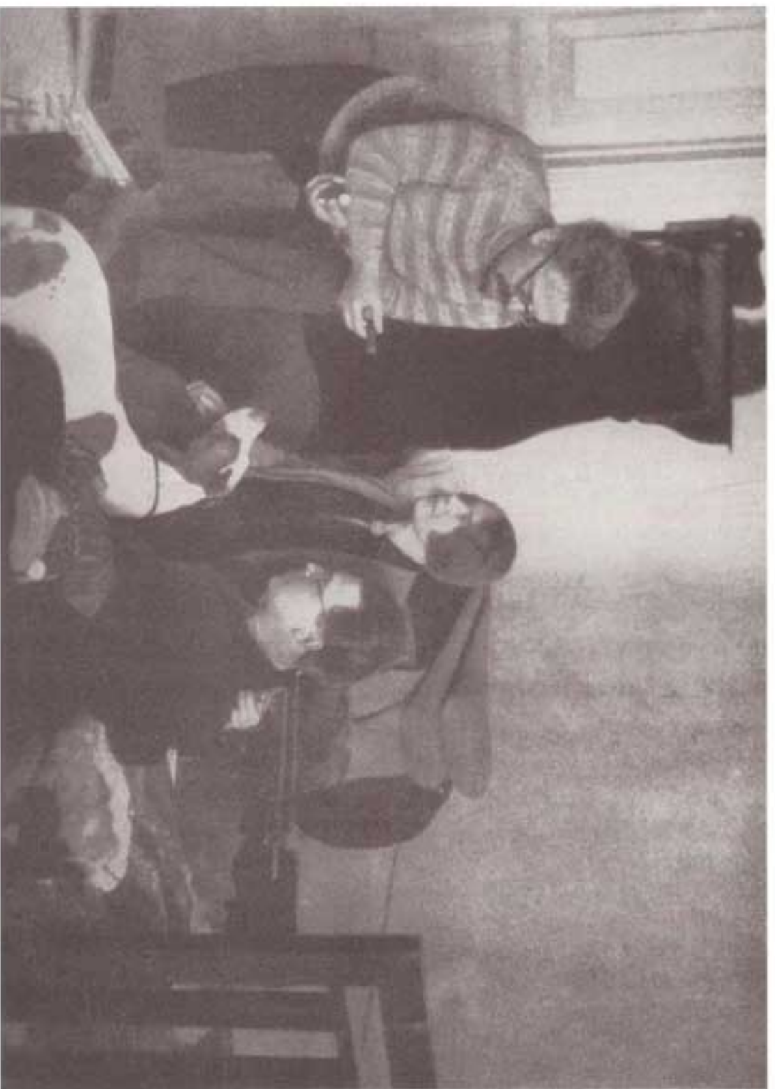
تروتسکی و خانواده‌اش در آلمان