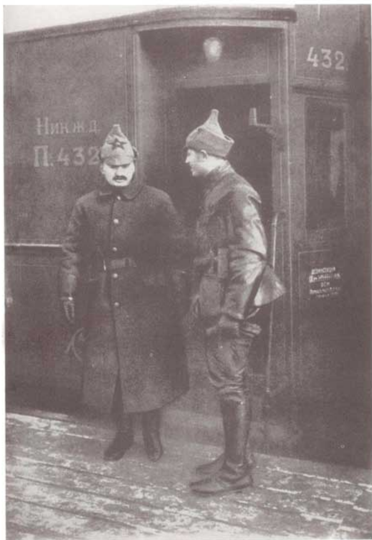
تروتسکی از «قطار نظامی» ستاد فرماندهیش پیاده می شود