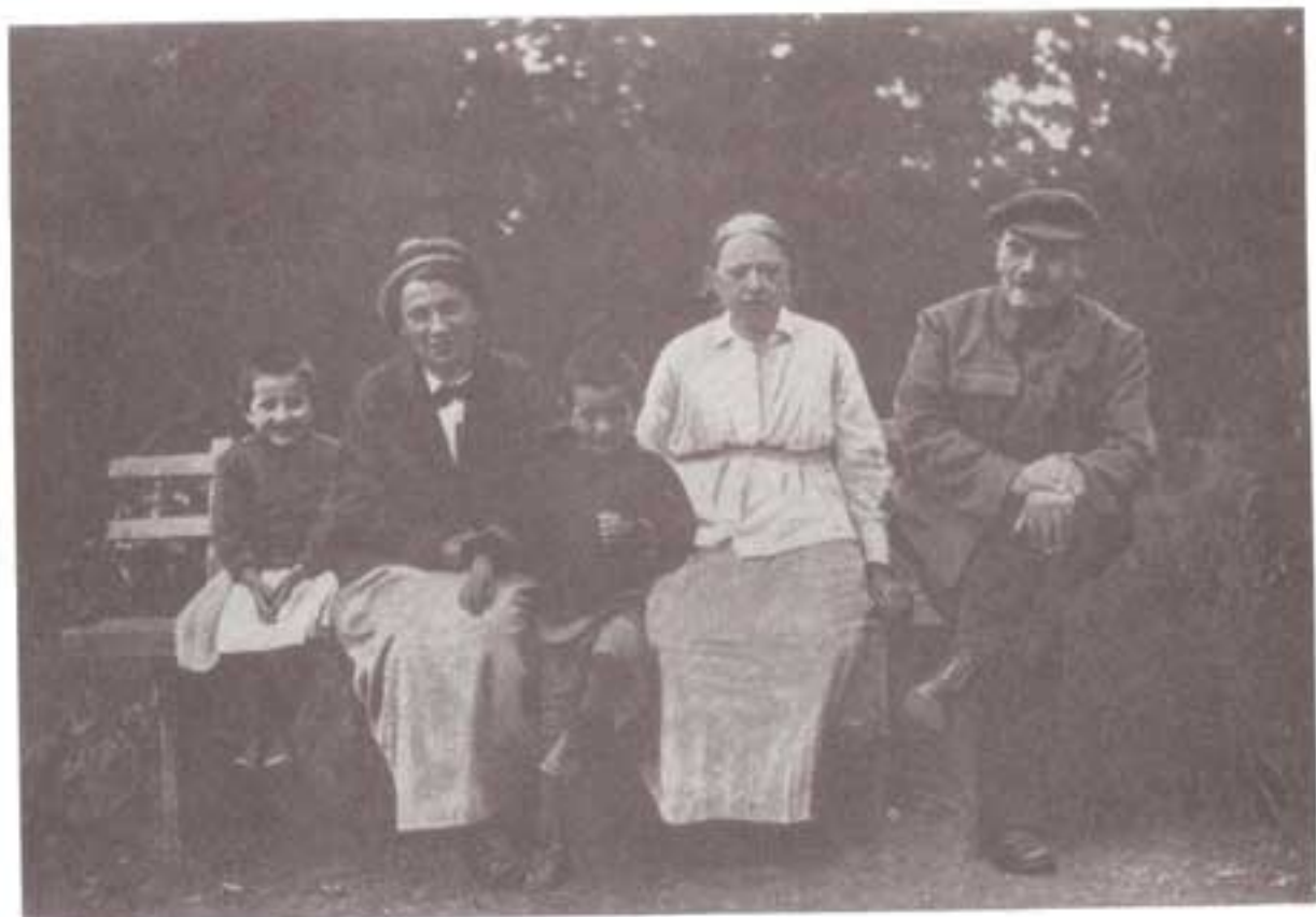
لنین و خانواده اش: کروپسکایا، همسرش در کنار لنین، و خواهر لنین الیزارووا