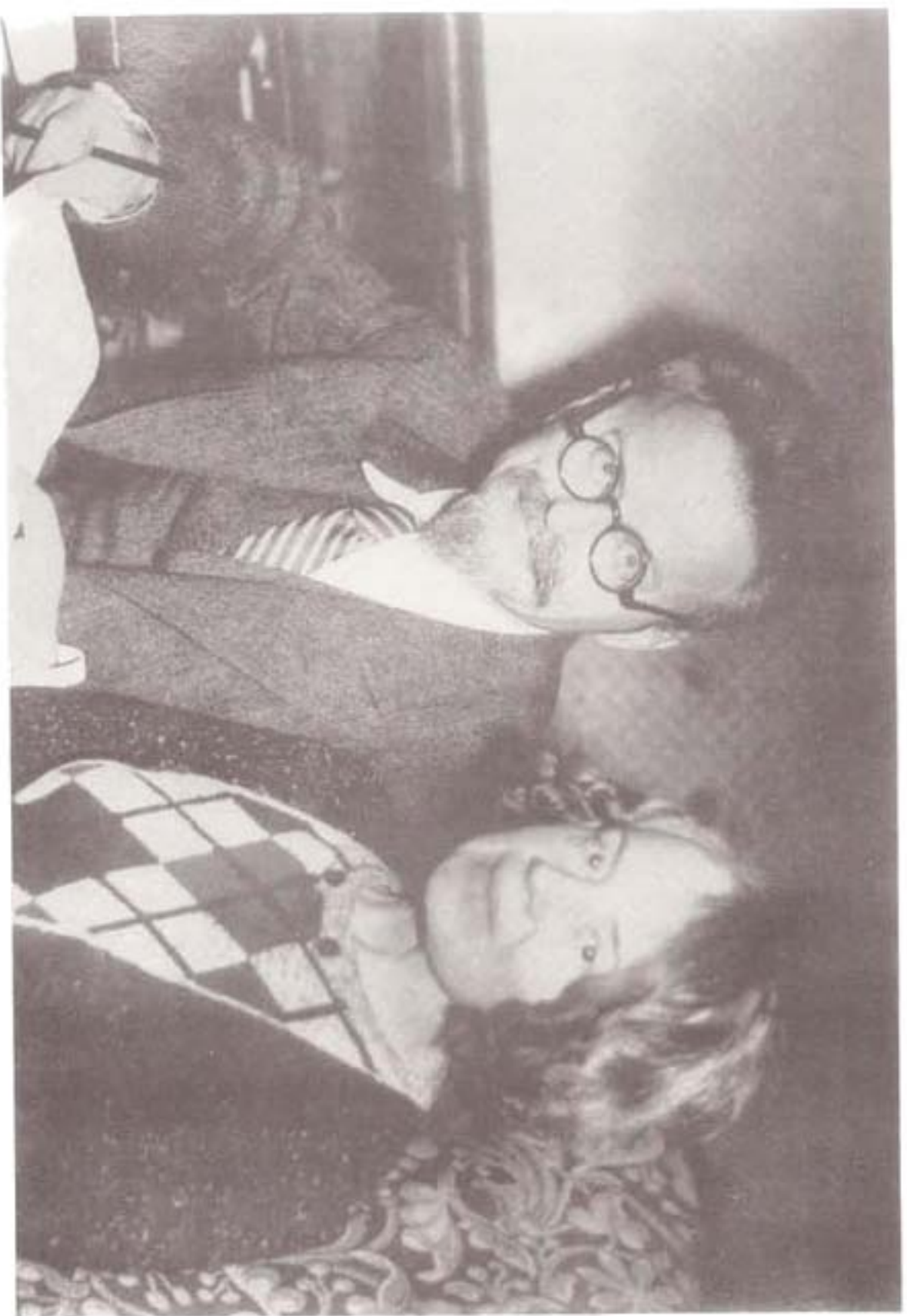
ترو تسکی و همسرش: بازگشت به پرنکیو از کینیاک، ۱۹۳۲ میلادی