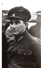
Polonsky Vladimir Ivanovich

33 V. POLONSKI : Nom donné par l' Histoire du parti communiste (bolchevik) de l'URSS , 1938, p. 277, parmi les chefs de l'organisation du parti à Moscou qui aidaient le « groupe de Boukharine ; peut-être Polonsky Vladimir Ivanovich (1893-1937) membre du POSDR depuis 1908, marin puis employé, c'est un syndicaliste, permanent du syndicat en 1913, il est en prison en 1914. Président des syndicats pour les régions méridionales de l'Union soviétique, il devient 1 er secrétaire du PC d'Azerbaïdjan en 1930 (jusqu'en 1933). Arrêté le 22 juin 1937, exécuté le 30 octobre 1937 [Source : wikipedia en.]