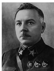
Vorochilov Kliment Iefremovitch

27 K.E. VOROCHILOV : L'Encyclopédie Larousse résume ainsi sa carrière : Vorochilov Kliment Iefremovitch, Maréchal soviétique (Verkhneïe, région de Lougansk, 1881-Moscou 1969). Membre du parti bolchevik depuis 1903, il dirigea, avec Staline, en 1918, la défense de Tsaritsyne (aujourd'hui Volgograd) et devint chef de la garde rouge (1919-1920). Nommé commissaire du peuple à la Défense (1925-1940), il dirigea en 1941 la défense de Leningrad. Il fut président du praesidium du Conseil suprême de 1953 à 1960. [Pour plus de détails voir wikipédia fr.]