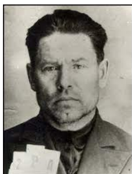
Rioutine Martemyan Nikititch