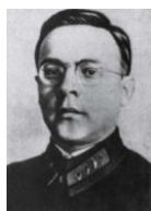
Primakov Vitaly Markovitch

64 PRIMAKOV : Primakov Vitaly Markovitch, (1897-1937) encore élève au gymnase, il rejoint le POSDR en 1914. En 1915 il est arrêté et exilé en Sibérie. Au cours de la guerre civile, il devient un chef militaire en Ukraine et, finalement, en 1920, il commande le 1 er corps de cavalerie cosaque. Wikipédia ajoute à ces informations qu'en 1930 il avait épousé Lili Brik (la sœur d'Elsa Triolet) et qu'il a été impliqué dans la répression des généraux de 1937 (il est arrêté le 22 mai et abattu le 12 juin, comme les autres).