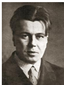
Syrtsov Sergey Ivanovich

activités du « groupe Sten-Lominadzé », qui semble avoir existé et avoir eu des relations avec d'autres opposants à Staline. Il est arrêté le 19 avril 1937 et abattu le 10 septembre 1937, sans procès public. Réhabilité en 1957 [Source : wikipedia en.]