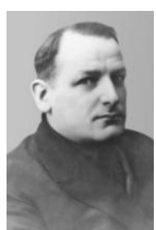
Mezhlauk Valery Ivanovich

17 V. MEZHLAUK : Mezhlauk Valery Ivanovich (1893–1938) Lituanien de naissance, après la guerre civile, il participe au commissariat des transports jusqu'en 1924, puis au conseil suprême de l'économie nationale (jusqu'en 1931). Il passe ensuite au Gosplan dont il est président en 1934. Vice président du gouvernement, membre du CC du PC. Il est arrêté en décembre 1937, condamné et exécuté en juillet 1938 (avec son frère aîné - son plus jeune frère les aurait dénoncés...). Excellent caricaturiste. [Source : wikipédia]