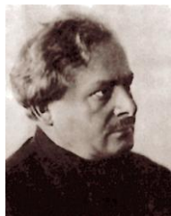
Yenukidze Avel Safronovitch

mise à l'écart en 1935 et de son implication dans les « complots » pourchassés par le NKVD. Arrêté en février 1937 et abattu en octobre 1937, il est fictivement associé à la condamnation de Karakhan (décembre 1937) et au procès de Boukharine et Iagoda (mars 1938). Réhabilité en 1960 [plus de détails dans wikipedia en.]