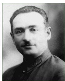
Peterson Rudolph Avgustovich

59 PETERSON : Peterson Rudolph Avgustovich (1897 - 21.8.1937), commissaire politique, général de division-intendant. Fils d'un employé. A participé à la première guerre mondiale. En avril. 1918 rejoint l'Armée rouge, et en 1919 entre dans le PC(b)R. En poste dans les communications de l'armée rouge, il aurait conduit le train de Trotsky pendant la guerre civile [non dit dans la notice RIN.RU]. Depuis avril. 1920, commandant du Kremlin de Moscou. En 1936, disgracié, il est d'abord nommé Commandant-adjoint du district militaire de Kharkov, Le 27/4/1937 il est arrêté. Accusé d'appartenir à "l'organisation fasciste lettone". [Selon le NKVD], il a plaidé coupable à toutes les accusations portées contre lui, en particulier d'avoir participé à la préparation de la conspiration militaire-fasciste dans le Kremlin et à la préparation des actes terroristes. Pendant l'enquête [selon le NKVD], il a nommé 16 "membres" de la conspiration, qu'il a personnellement recrutés. Le 21/8/1937, il est condamné à mort et abattu. Réhabilité en 1957. [Source : RIN.RU, reprenant des sources soviétiques anciennes] Il existe une photographie de Peterson :