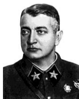
Toukhatchevski Mikhaïl Nikolaïevitch

NKVD monte une accusation d'espionnage et de complot. Toukhachevski est arrêté le 22 mai 1937 et abattu avec quelques autres officiers généraux le 12 juin 1937. [Source : wikipedia en.]