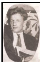
Vasilii plus âgé

2 D. MARETSKII : Maretskii , Dmitrii Petrovich (1901–1938 ou 1937) Membre du parti à partir de 1919, élève à l'IPR, il est présent sur deux photos d'élèves de l'IPR avec Boukharine [Source : Michael David-Fox, Revolution of the Mind , 1997, p 185]. Auteur d'une biographie de Boukharine dans la Grande Encyclopédie Soviétique (1926), collaborateur de la Pravda jusqu'en 1929 (entre aout 1928 et l'été 1929 il est le seul des élèves de Boukharine encore en poste à la Pravda ) [Source : Lettres de Staline à Molotov (ed. Lars t. Lih)]. [Source : Closer to the masses (Mathew Lenoe).]. Fusillé le 26 mai 1937 (comme son frère Grigorii ?) [Source : Broué ( Communistes contre Staline , 2003)]