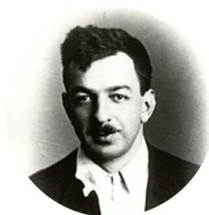
Lominadze Vissarion Vissarionovich

62 TUKHACHEVSKY : Toukhatchevski Mikhaïl Nikolaïevitch (1893-1937) officier formé à l'académie militaire Alexandre, sous-lieutenant en 1914, il est prisonnier des Allemands en 1915. Evadé, il revient à Petrograd en octobre 1917. En 1918, il devient membre du parti bolchevik et commissaire politique dans l'armée rouge. Il multiplie les succès comme chef militaire jusqu'à l'échec de la contre-offensive qu'il conduit en 1920 en Pologne. C'est encore lui qui commande contre les marins de Kronstadt et les paysans de Tambov (1921). Après la guerre civile, il est d'abord commandant de l'académie militaire (1921), puis chef d'Etat-major général (1924-1928). Commandant de la région militaire de Léninegrad (1928), il devient vice-ministre de la défense (1931) et il est nommé maréchal en 1935 (il a 42 ans). Staline et l'OGPU, dès 1930 avaient monté un dossier d'espionnage contre lui, mais ils y avaient renoncé. En 1937 Staline et Iejov vont jusqu'au bout : en utilisant de fausses informations destinées à l'espionnage allemand ou fabriquées par ses soins, le