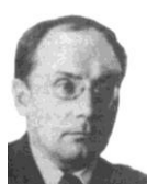
Stetskii plus âgé

14 P. PETROVSKII : Petrovsky Piotr, fils du Président de la CEC d'Ukraine, Gregori Petrovsky