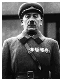
Iagoda Guenrikh Grigorievitch

25 IAGODA Iagoda Guenrikh Grigorievitch (1891-1938) : Bolchevik en 1907, entre dans la Tcheka en 1919, succède à Menjinski à la tête du NKVD en 1934, il en est écarté en septembre 1936 et il est arrêté le 3 avril 1937. Accusé au même procès que Boukharine, condamné et exécuté le 15 mars 1938. {peu de détails dans wikipédia fr.}