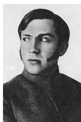
Putna Vitovt Kazimirovitch

65 PUTNA : Putna Vitovt Kazimirovitch (en lituanien : Vytautas Putna), né le 31 mars 1893 dans le Gouvernement de Vilna et mort le 12 juin 1937 à Moscou est un ancien combattant lituanien de la Première Guerre mondiale au sein de l'Armée impériale russe, qui devint officier de l'Armée rouge. Attaché militaire soviétique à Berlin, puis, à Londres, il fut victime des Grandes Purges et du procès de Moscou. Ses témoignages obtenus sous la torture déclenchent une nouvelle vague d'arrestations et précipitent notamment l'arrestation de Mikhaïl Toukhatchevski. Fusillé après un procès truqué, il est enterré dans la fosse commune du cimetière Donskoï, il sera réhabilité en 1957. Vitovt Putna est l'auteur de deux livres de mémoires de guerre, Un aller retour pour la Wisla (К Висле и обратно, К Висле и обратно, Moskva, 1927) et Front de l'Est (Восточный фронт, Vostochny front, 1959).