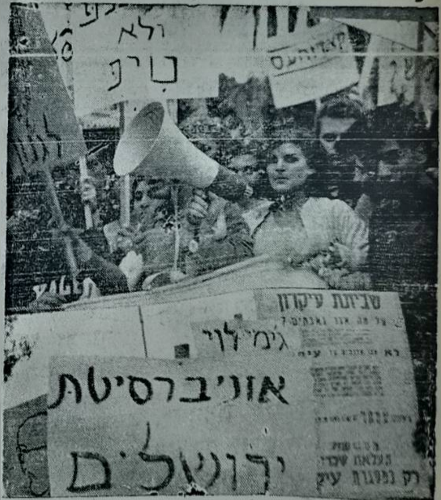
הפגנת ימין באוניברסיטה העברית

בשנת 1967 אירגן המחנה הימני באוניברסיטה העברית, הפניה נגד העלאות שכר לפועלים שאר ההפגנות של הימין הסבעד ההתנחלויות ב- שטחים וכו'.