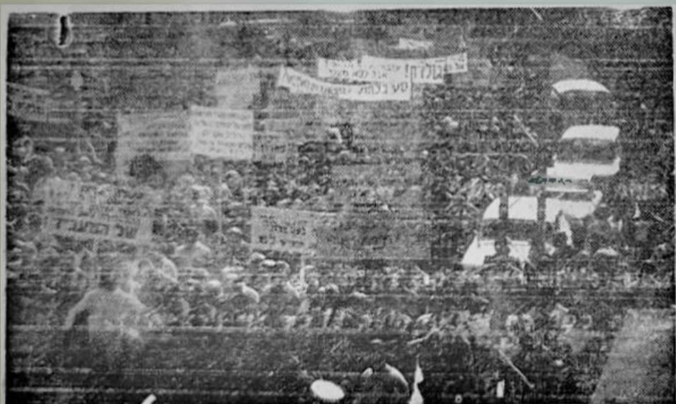
הפגנת פועלים וסטודנטים

רוב הסטודנטים, נמנים עם השחקנים, אלה סטודנטים שכל מה ש- מעין אותם, הם בעיותהם האישיות, דאגתם לעצמם מנתקת אותם מו