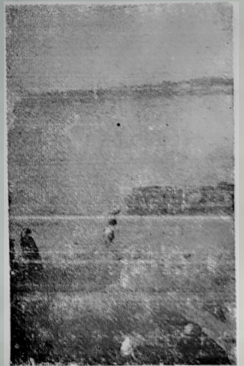
על נהרות בבל...

אולם זרם זה היה דקיק, כלל בעיקר בני-נוער. אחת הסיבות: חלק ניכר מהנוער המשכיל היהודי היה קשור עם הקומוניסטים העיראקיים, חשב כי תפקידו לנהל את המאבק לשינוי פני הממשלה בעיראק. הרגשת-השור-תפות היתה הדדית: הקומוניסטים העיראקיים ערכו הפגנה בבגדאד, בפרוץ מלחמת העצמאות, בה קראו להכרה בזכות העם היהודי להקים מדינה עצמאית.