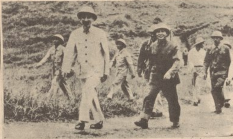
El Genral Giap y el Presidente Ho participando en maniobras de una de las divisiones en el instituto militar en la providencia Son Tay (1957)

Claramente, los revisionistas soviéticos y su portavoz, el P.C.E.U. (Partido Comunista de los EE.UU.), están tratando de convencer a los pueblos del mundo, que desde la derrota del imperialismo norteamericano en Viet Nam los EE.UU. han cambiado su naturaleza fundamental - se han convertido en más razonables, y están dispuestos a retirarse para lograr así un relajamiento en las tensiones, y luego entonces la posibilidad de una transición pacífica al socialismo está ahora en existencia.