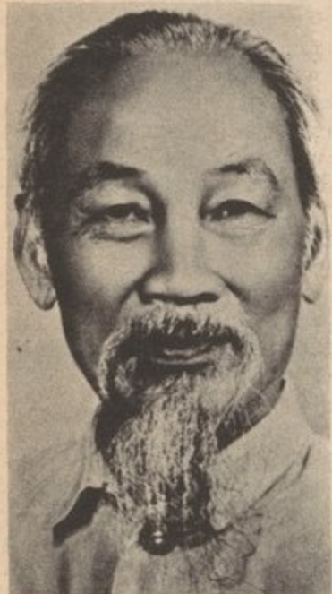
Ho Chi Minh