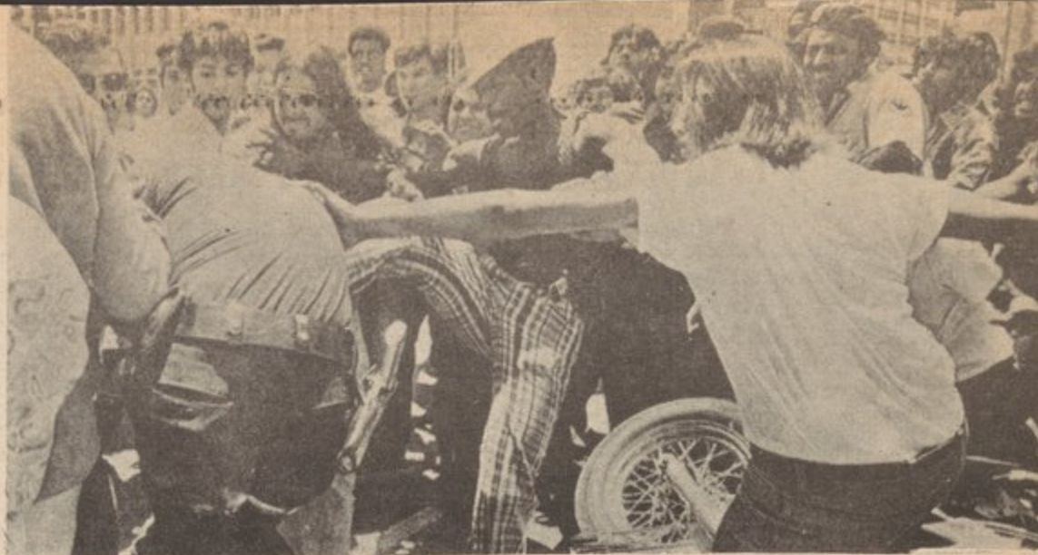
Asesinatos y brutalidad policiaca intensifican cuando la burguesía trata de poner la carga de la crisis sobre los ombros del proletariado y las masas trabajadoras y atenta aplastar el levantamiento revolucionario. Arriba, manifestación protestando el asesinato policiaca de un hermano joven chicano en Dalas, Tejas, julio 1973.

Lo importante es entender que el papel del estado burgues se "estabilizar" a travez de la coerción y la violencia, el régimen actual y prevenir que la contradicción irreconciliable entre la burguesía y el proletariado no se resuelva con la revolución proletariada. Esta es la razón por la cual su aparato se pone en marcha cuando el capitalismo está en crisis, como hoy. La burguesía sabe que los pueblos se estan levantando en un gran movimiento social, y que la represión tiene que ser fuerte, especialmente al usar el estado, para así retrazar su colapso final.