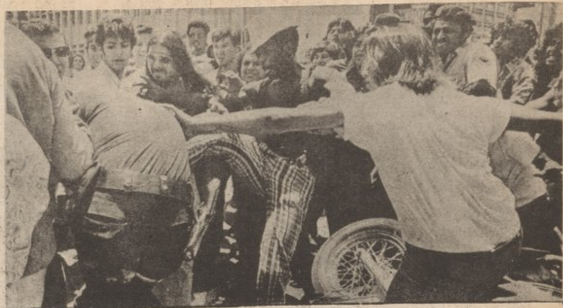
Murders and brutality by the police increase as the bourgeoisie tries to put the burden of the imperialist crisis on the backs of the proletariat and masses of people, and attempts to crush the revolutionary upsurge. Above, demonstration protesting the police murder of a young Chicano brother in Dallas, Texas, July 1973.

The key thing to understand is that the role of the bourgeois state is to, through violence and coercion, "stabilize" the existing order and prevent the irreconcilable contradictions between the proletariat and the bourgeoisie from resolving itself through proletarian revolution. That's why its apparatus gears up when capitalism is in a crisis, like what is happening today. The bourgeoisie knows the people are rising in a great social upheaval and that they must come down hard, especially through use of the state, to forestall their ultimate collapse.