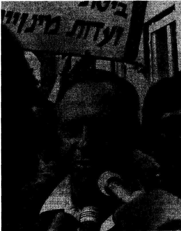
Israelischer Ministerpräsident Yitzhak Rabin

Moked, die anstrebt, eine sozialdemokratische Partei zu werden, ruft auf der ökonomischen Ebene zum Kampf für die gleitende Lohnskala auf, während sie auf der politischen Ebene die Regierung unter Druck setzen will, damit diese das imperialistische Friedensarrangement für den Nahen