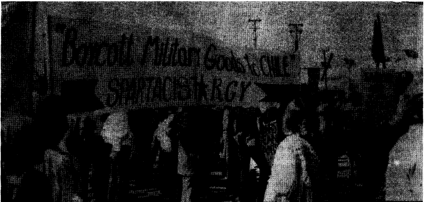
SL-Demonstration für Arbeiterboykotts gegen die chilenische Militärjunta an der amerikanischen Westküste im Juni 1974

(NMU) gefordert wurde. Oder in Verbindung mit spezifischen, realisierbaren Forderungen wie die Befreiung gefangener Genossen. Es wäre auch für die chilenische Junta nicht zu übersehen, wenn als Antwort auf die Hinrichtung eines gefangenen Genossen die Hafnarbeiter von London, Hamburg oder San Francisco einige Tonnen chilenischen Kupfers über Bord werfen würden.