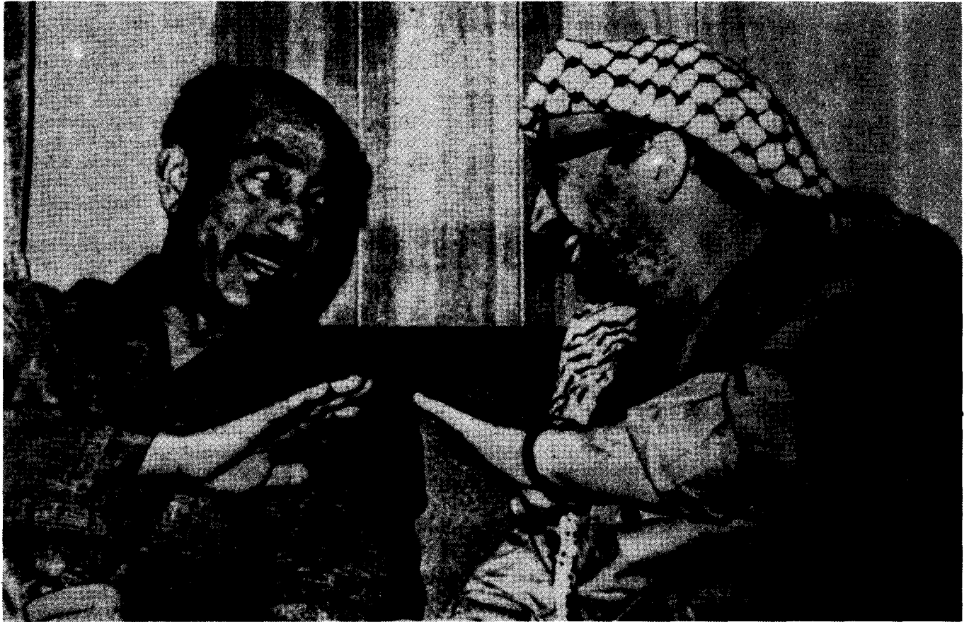
Sadat und Arafat

ja eine richtige Beobachtung, die der Beginn zum Verständnis der permanenten Revolution hätte sein können. Stattdessen vertrat sie weiterhin eine Art „nationaler Einheitsfront“, die möglicherweise einige arabische nationalistische Regime und sicherlich die „progressive“ palästinensische Bourgeoisie und Kleinbourgeoisie einschloß, während sie die Masse der hebräischen Arbeiter ausschloß. An dieser Front könnten innerhalb Israels sich allerhöchstens noch einige „progressive Intellektuelle“ beteiligen.