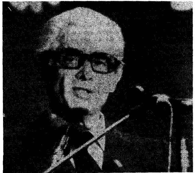
Cunhal, Chef der portugiesischen Stalinisten und Mitglied der bürgerlichen Regierung

Gegen die Sozialdemokratie hebt Tanas den Stalinismus ab, der 1. zentristische Strömungen hervorbringen könne und 2. ein rechtmäßiger Teil der Arbeiterbewegung sei, der lediglich mißbraucht werde. Kurz und aktuell: die DKP wird im bewußten Gegensatz zur SPD als „besondere Arbeiterpartei“ hochstilisiert. Demgegenüber gilt es festzuhalten: 1. Auch aus dem sozialdemokratischen Reformismus heraus können zentristische Strömungen erwachsen: siehe die Analysen Trotzki's, die im Zusammenhang mit der „französischen Wende“ stehen, siehe die SAP. Die SAP taucht übrigens bei Tanas in einem merkwürdigen Zusammenhang auf: in der Anmerkung 229 (a.a.O., S. 107) wird völlig unvermittelt sowohl zum Text als auch zum ersten Teil der Anmerkung die Herausbildung der SAP („1929“? !) und der USPD („in der SPD nach 1919“? ? !) als Kriterium für die Entrismustaktik angeführt!!! Man fragt sich, warum nicht die Komintern der deutschen KP den Entrismus in die USPD und Trotzki der Linken Opposition den in die SAP empfohlen hat – Tanas weiß nicht, was er schreibt.