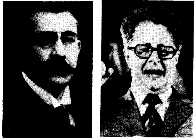
Sozialdemokraten sorgen für „Ruhe und Ordnung“: Bluthund Noske und Bundesjustizminister Vogel

„In seinem Kampf gegen die Ökonomen identifiziert Lenin das Gewerkschaftsbewußtsein (in England und in den USA) als die Quelle des reformistischen Einflusses, d.h. des bürgerlichen Einflusses, innerhalb der Arbeiterklasse. In den ersten Etappen des Kampfes gegen die Ökonomen standen die späteren Menschewiki auf der