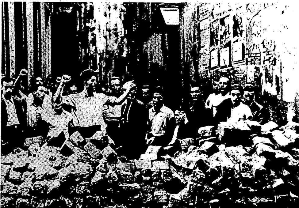
En juillet 1936, les ouvriers érigent des barricades pour assurer la défense de Barcelone contre les généraux rebelles.

«On ne se bat pas pour la Quatrième Internationale quand on flirte avec eux [le POUM et ses alliés] en chambre close, qu'on fait antichambre chez eux ou qu'on leur rend des