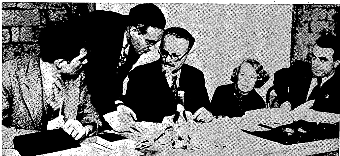
Trotsky dépose devant la Commission Dewey.

échoué. Effectivement, à la réunion du 30 octobre 1975, la LCR avait fait savoir qu'elle était d'accord pour participer à une commission sur la base d'une déclaration d'intention, soumise par la LIRQI, et selon laquelle les accusés eux-mêmes siègeraient parmi les juges. La Ligue Communiste Révolutionnaire entraînait ainsi dans un bloc avec les varguistes, sur cette base sans principes — probablement pour marquer des points contre l'Organisation Communiste Internationaliste (OCI), et peut-être aussi pour troubler le rapprochement entre cette dernière et le Socialist Workers Party (SWP) (voir Spartacist édition française, No. 8, février 1975) qui est le dirigeant idéologique de la fraction minoritaire du Secrétariat «Unifié» de Mandel, Krivine & Cie. La LCR combattit donc nos arguments contre une telle «cour d'exception»: se référant à un article de Workers Vanguard (hebdomadaire de la Spartacist League, section américaine de la tendance spartaciste internationale) qui, sur la base du long article publié dans l'édition française de Spartacist six mois auparavant, qualifiait Varga de «hautement douteux», elle alla jusqu'à renforcer le texte proposé par la LIRQI en y ajoutant une clause dont le but explicite aurait été d'exclure la TSI de la commission. Lutte Ouvrière (LO), à cette occasion, joua un rôle confusionniste et se solidarisa avec la LCR, allant jusqu'à proposer une commission qui