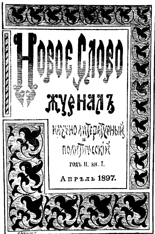
Copertina del Novoic Slovo