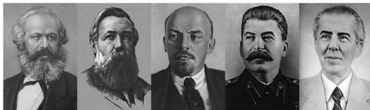
Karl Marx, Friedrich Engels, Vladimir Lenin, Joseph Stalin, Enver Hoxha