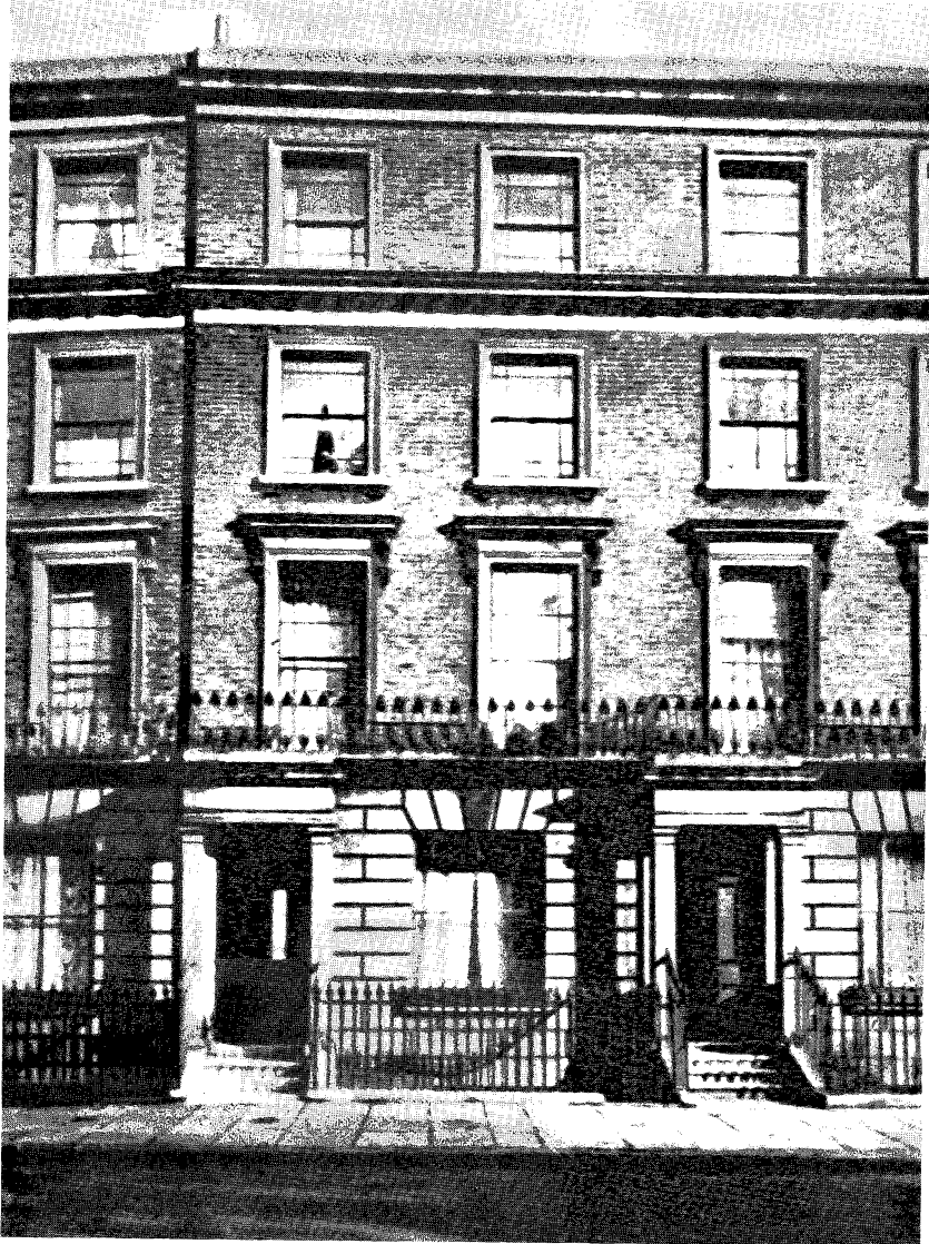
Az a londoni ház (122, Regent's Park Road), amelyben Engels 1870-től 1894-ig lakott