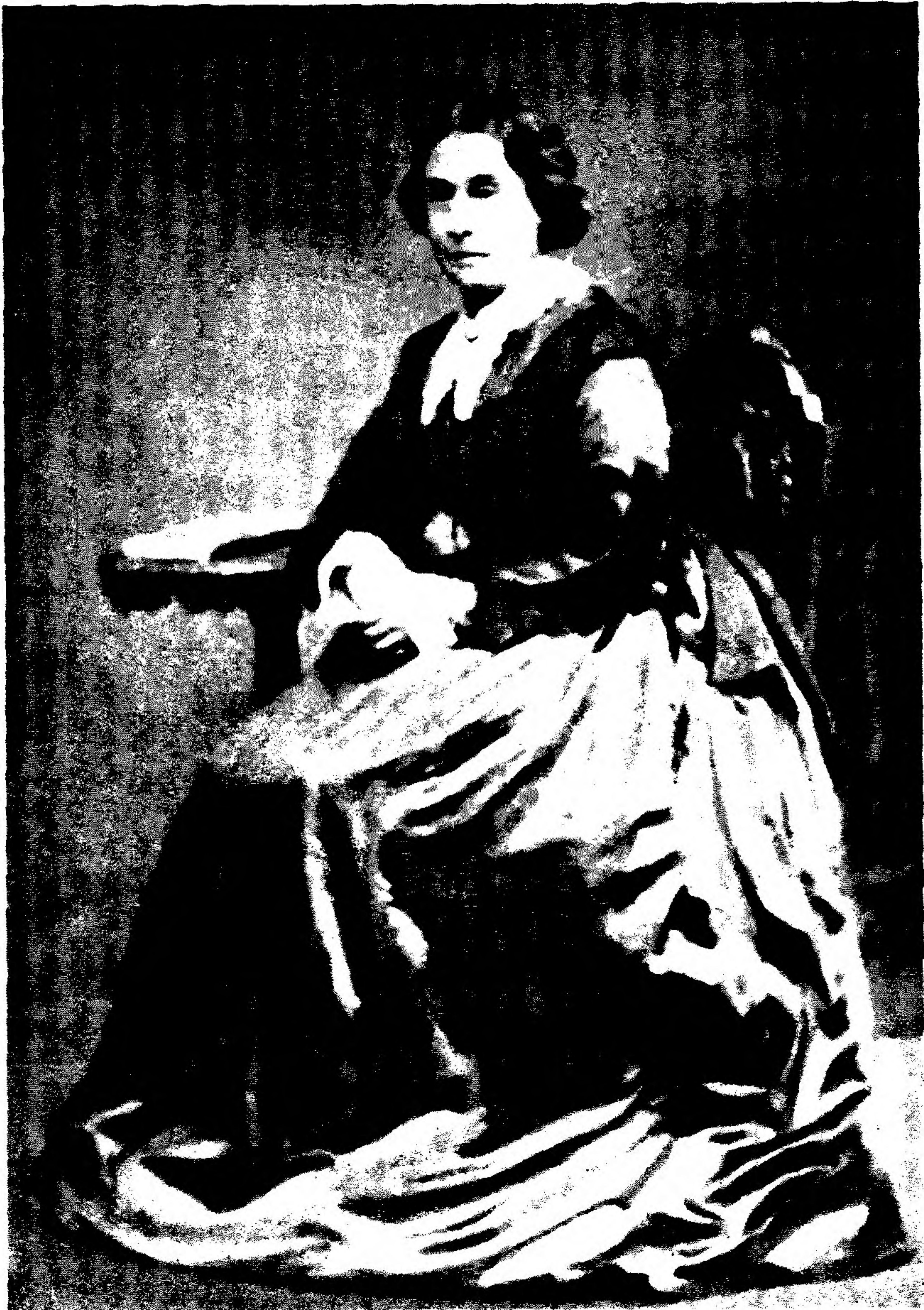
Jenny Marx (élete utolsó éveiben)