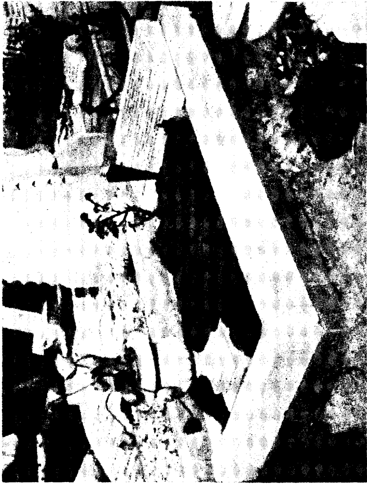
Karl Marx sírja a londoni highgate-i temetőben (az 1956. évi emlékmű-állítás előtt)