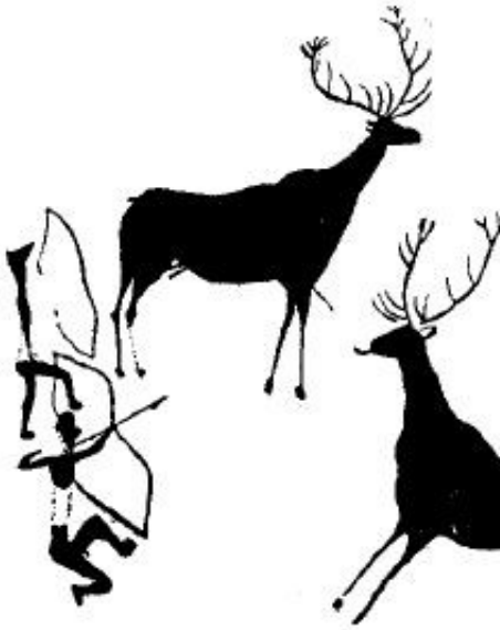
HUNTING SCENE Stone Age Painting