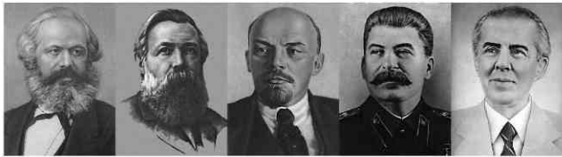
Karl Marx, Friedrich Engels, Vladimir Lenin, Joseph Stalin, Enver Hoxha