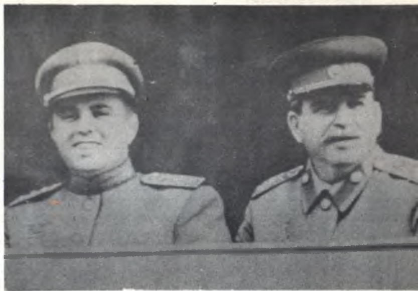
J. V. Stáline e o camarada Enver Hoxha no Estádio central de Moscovo. Julho em 1947.