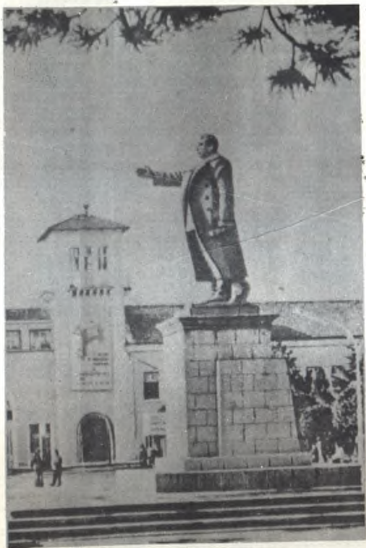
O monumento a José Stáline na praça situada em frente ao complexo têxtil "Stáline" em Tirana (Obra do escultor O. Paskali).