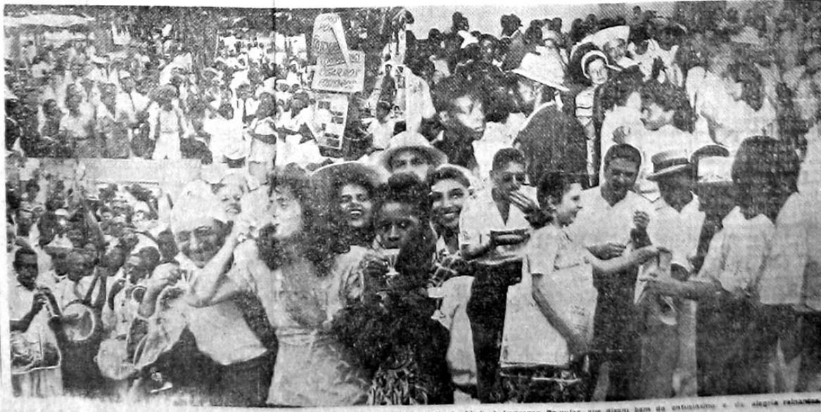
na Granja das Gargas por iniciativa do Movimento de Ajuda à Imprensa Popular, que reuniu bem de 1000 pessoas e de alguma relevância

Obteve o maior êxito a festa realizada domingo último na Granja das Gargas, em Campo Grande, sob o patrocínio do M.A.I.P. Mais de mil pessoas acorreram ao agradável local, levando, assim, sua solidariedade, alegria e entusiasmo a mais bela iniciativa pela vitória da Campanha de Reconstrução das oficinas de gloriosa «TRIBUNA POPULAR». Mulheres e crianças, vindas da classe social, estiveram ali reunidas das primeiras horas da manhã às 7 da noite, numa simpática camaradagem festiva e, ao mesmo tempo, dando provas de que, mesmo divertindo-se, o povo sabe contribuir para que a