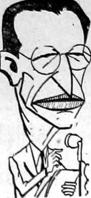
De Gasperi, que tem no gabinete antigos serviços de Mussolini, hoje à disposição de Truman

A Confederação Geral do Trabalho da Itália pediu ao governo a dissolução do MSI e a adoção de medidas eficazes contra as atividades fascistas. Somente assim a calma poderá voltar à classe trabalhadora.