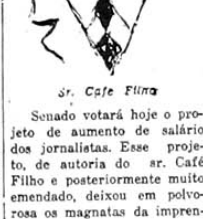
Sr. Cafe Filina

Alarmado pela marcha dos acontecimentos, o órgão do Partido Republicano, moderado, "la voce Republicana", observou: "Com a volta dos fascistas para a administração, vimos o começo do 'expurgo' em sentido contrário, contra os anti-fascistas e os republicanos... Se as mesmas nas cidades industriais perderam a paciência e destruíram jornais e sedes de organizações fascistas, sua violência é perfeitamente compreensível em