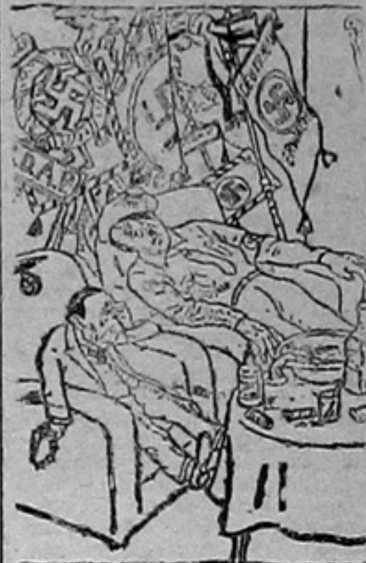
Desfiles, cerimonia, fogo de artifício, nisso tudo somos incomparáveis. Mas como, agora, dar pão ao povo?