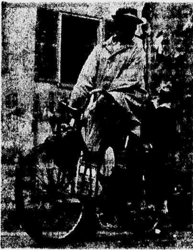
Tio Hulot e o sobrinho Gérard. Vocês vão rir muito com eles.