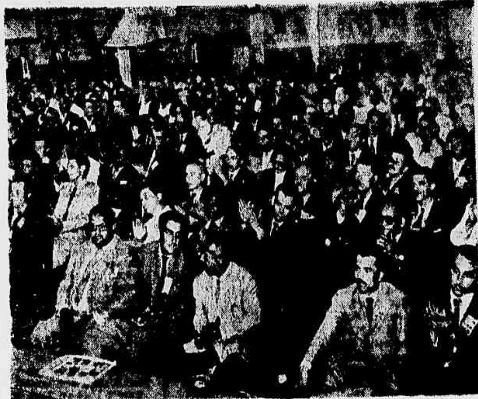
Aspecto de uma das sessões plenárias do II Congresso dos Trabalhadores do Estado do Rio, que se reuniu de 27 a 30 de junho no Teatro Municipal de Niterói

A cláusula 51 do referido contrato estabelece que a sua continuação em mãos da contratante para dele usar