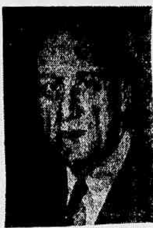
JORGE ALESSANDRI, presidente do Chile