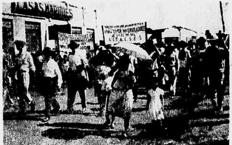
Mulheres, com crianças ao colo, velhos e jovens lavradores, todos participaram da passeata e da assembléia.

O contrato de trabalho, ajustado por escrito ou verbalmente, só pode ser alterado pelo consentimento de ambas as partes e, ainda assim, — diz a lei, — se não resultar prejuízo para o empregado. As alterações mais graves, no entendimento da Justiça, são, entre outras as que acarretam redução de salário, mudança e relaxamento de categoria profissional. A alteração, que é também uma violação do contrato, dá motivo a que o empregado reclame na Justiça o restabelecimento da condição alterada ou a rescisão contratual, com o pagamento das indenizações.