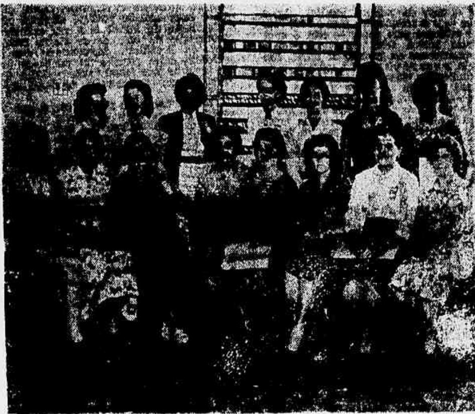
Um grupo de delegadas tecelãs ao I Congresso Nacional de Operários Têxteis, em pose especial para NOVOS RUMOS.

de proteção aos trabalhadores no campo, a aprovação da Lei Orgânica da Previdência Social e do Direito de Greve, medidas de proteção a indústria nacional e de limitação das remessas de lucros das empresas estrangeiras para o exterior, ampliação do comércio exterior brasileiro, plano concreto de combate a carestia de vida, participação dos trabalhadores nos órgãos encarregados do abastecimento e do controle de preços e outras medidas de interesse particular dos trabalhadores e do movimento sindical fluminense.