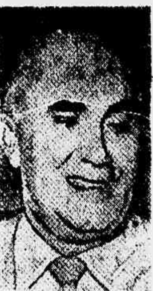
Coronel Crisanto Figueiredo, novo chefe de Polícia