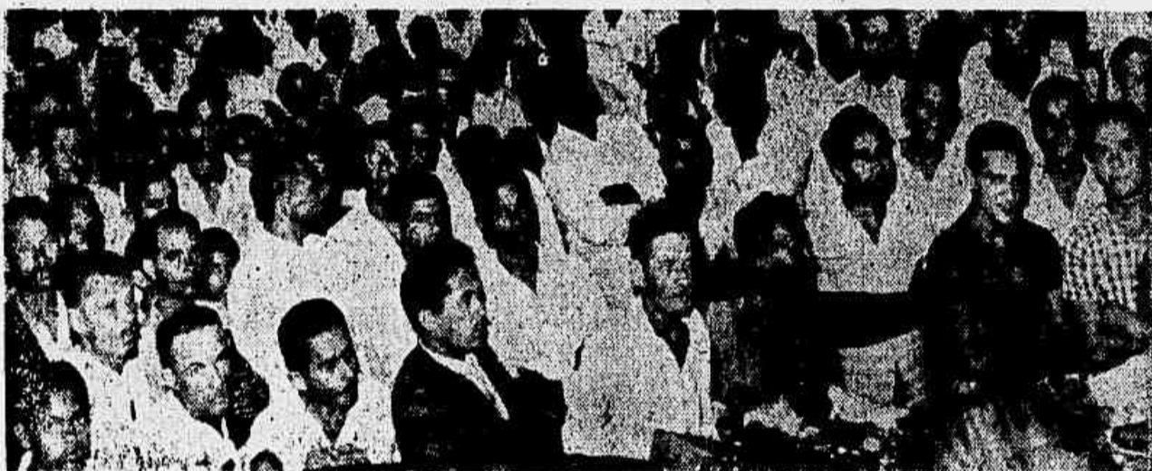
O auditório do Colégio Estadual de Alagoas foi pequeno para conter a numerosa assistência interessada em ouvir a palavra de Luiz Carlos Prestes

Deliberou-se, ainda, que todas as teses e propostas, relatórios e moções aprovados sejam impressos em livro e distribuídos às entidades participantes ou não do conclave, bem como impressão em forma de folheto da proposta sobre o plano de ação e distribuição do mesmo ao povo. Para dar continuidade aos trabalhos e dirigir até à próxima Convenção, a luta em prol da aplicação das medidas aprovadas, foi eleita uma Comissão Executiva Permanente.