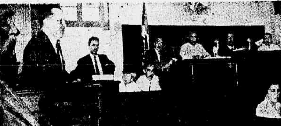
Da tribuna da Assembleia Legislativa, onde foi oficialmente recebido, Prestes, entre outras coisas, agradeceu à Casa o interesse manifestado pela revogação da ordem de prisão preventiva, pelo juiz Monjardim Filho

Convidado a ocupar a tribuna daquela casa legislativa, Luiz Carlos Prestes proferiu um discurso de agradecimento. Expressou, de início, seu reconhecimento à Assembleia de Alagoas por se ter conatulado com o juiz Monjardim Filho, quando do ato do magistrado carioca revogando a ordem de prisão preventiva que pesava há anos sobre ele e vários cidadãos. Passando a falar sobre problemas políticos atuais, Prestes encareceu, notadamente a necessidade de uma ampla unidade das forças democráticas e nacionalistas para levar o governo a realizar aquelas medidas que correspondam aos interesses de um desenvolvimento independente e democrático do