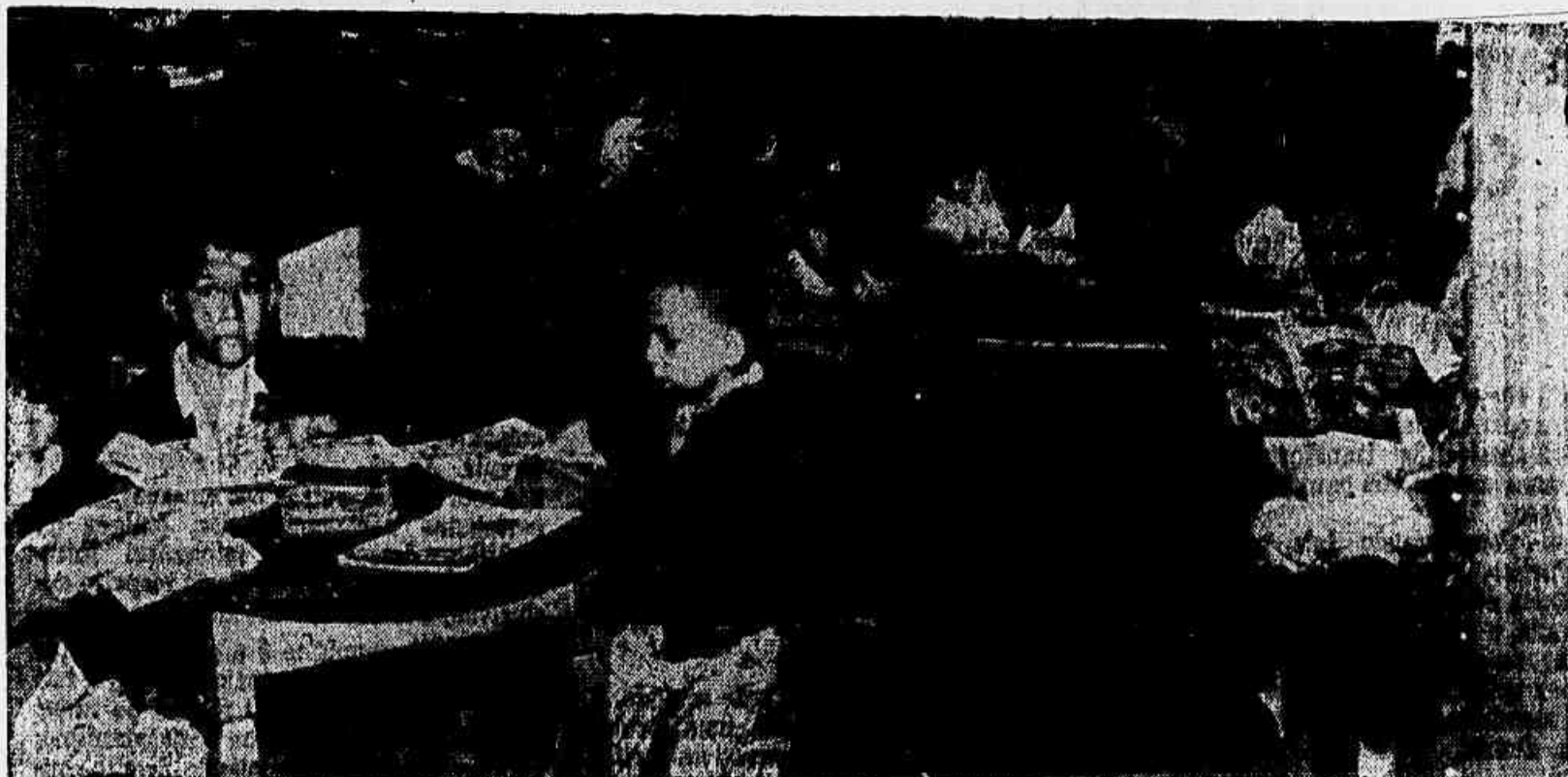
Na Biblioteca Popular de Copacabana as crianças têm o seu recanto com livros e revistas selecionadas.