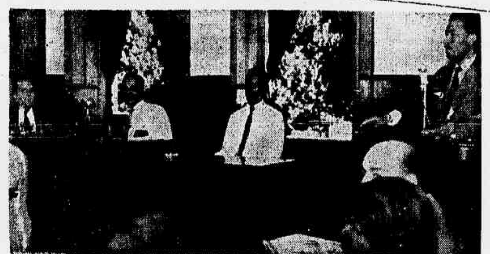
Recebido na Câmara Municipal, onde foi convidado a sentar-se à mesa, Prestes é saudado pelo vereador Renalvo Siqueira