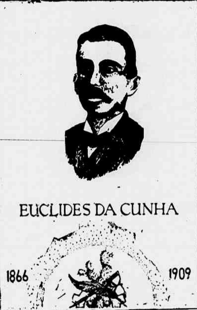
EUCLIDES DA CUNHA

O ter sido o porta-voz deste profundo anseio de vida explica o fato de Euclides da Cunha permanecer tão atual em nossa literatura, sucederem-se as edições de seu livro apaixonante e o drama de Canudos palpitar ainda, como se tivesse acontecido ontem, objeto constante de interesse, meio século depois do desaparecimento do autor de «Os Sertões».