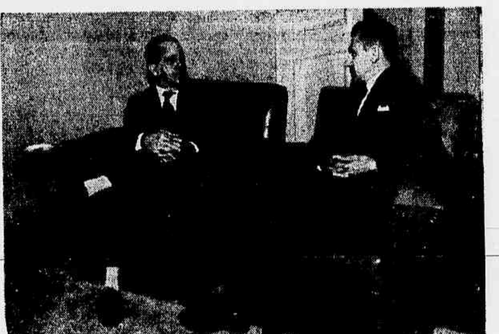
Durante mais de uma hora, Luiz Carlos Prestes entrevistou-se com o governador Muniz Falcão, debatendo uma série de problemas da atualidade