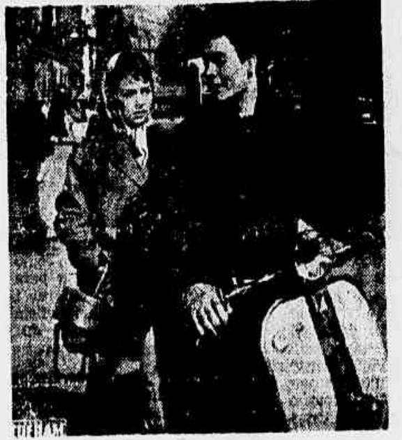
Pascale Petit e Jacques Charrier, «Juventude transviada» francesa.