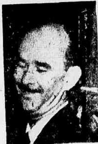
Ministro Sebastião Paes de Almeida

Quando o sr. Sebastião Paes de Almeida responsabilizou o aumento do salário-mínimo pela brusca elevação do custo de vida nos últimos meses, falou antes como patrão, como industrial de vidros, do que como ministro da Fazenda. Efetivamente, como autoridade máxima da política econômico-financeira do governo, é absolutamente indiscutível, porque falava do princípio ao fim, a afirmação feita pelo ministro em sua última entrevista coletiva à imprensa.