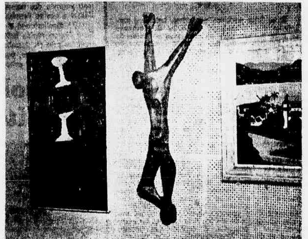
A Exposição, que tem despertado grande interesse, conta com obras de Portinari, Segall, Di Cavalcanti, Pancetti Guignard, Volpi, Tarsila, Dianira, Seliar, Dacosta, Iberê, Heitor dos Prazeres, Goeldi, Abramo, Fayga, Grassman, Brechete, Giorgi Cravo e Santa Rosa. Na foto, um aspecto da exposição.

A Galeria Macunaima, cujo nome — título de uma obra de Mário de Andrade — é uma homenagem a um dos intelectuais que maior esforço desenvolveu em prol do surgimento de uma cultura verdadeiramente nacional, faz parte de um conjunto de realizações que esse grupo pretende patrocinar. A fim de desenvolver as atividades artísticas baseadas em motivos brasileiros,