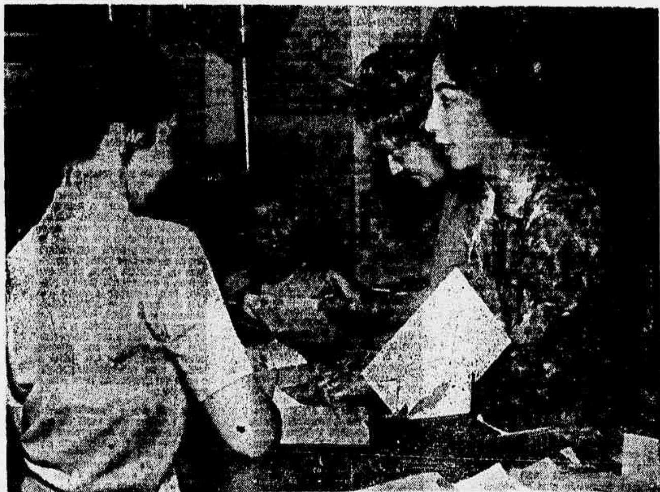
Que livro vou ler? Se o problema é este as jovens bibliotecárias resolvem-no em poucos segundos. Ganha e solicita, atendem a todas com presteza.