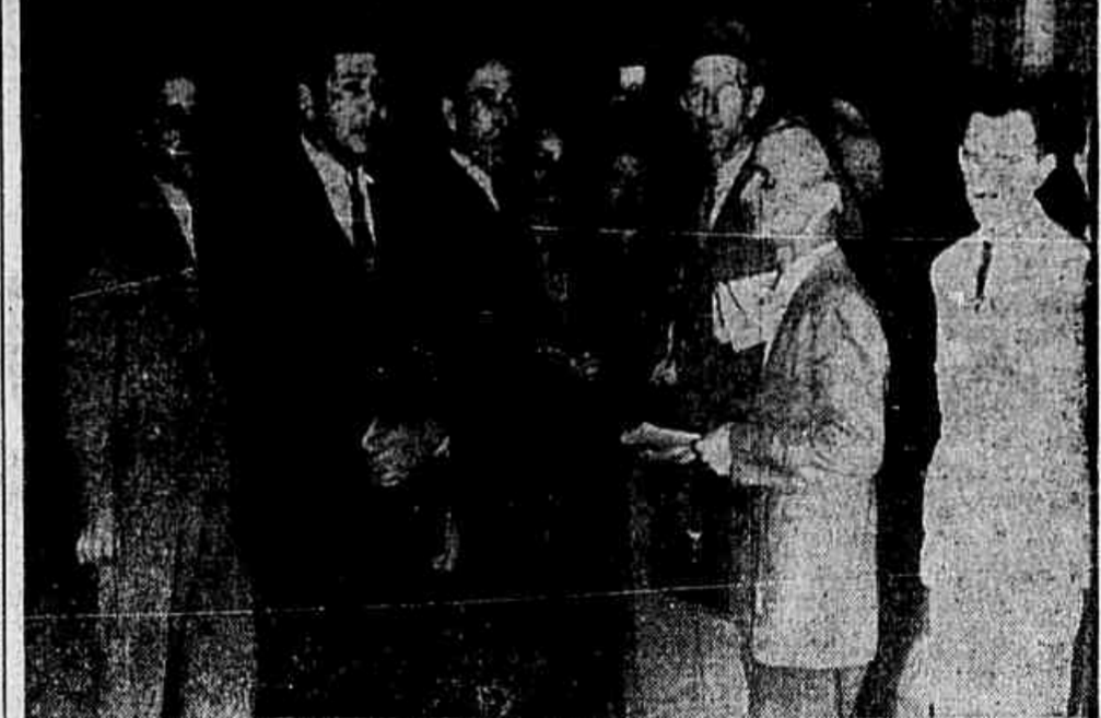
O presidente do Sindicato dos Trabalhadores na Indústria da Energia Elétrica, de Niteroi e outros diretores Jalandó á nossa reportagem.

O presidente do Sindicato e uma grande comissão no palacio do Ingá — Afastada a ameaça de paralização dos serviços