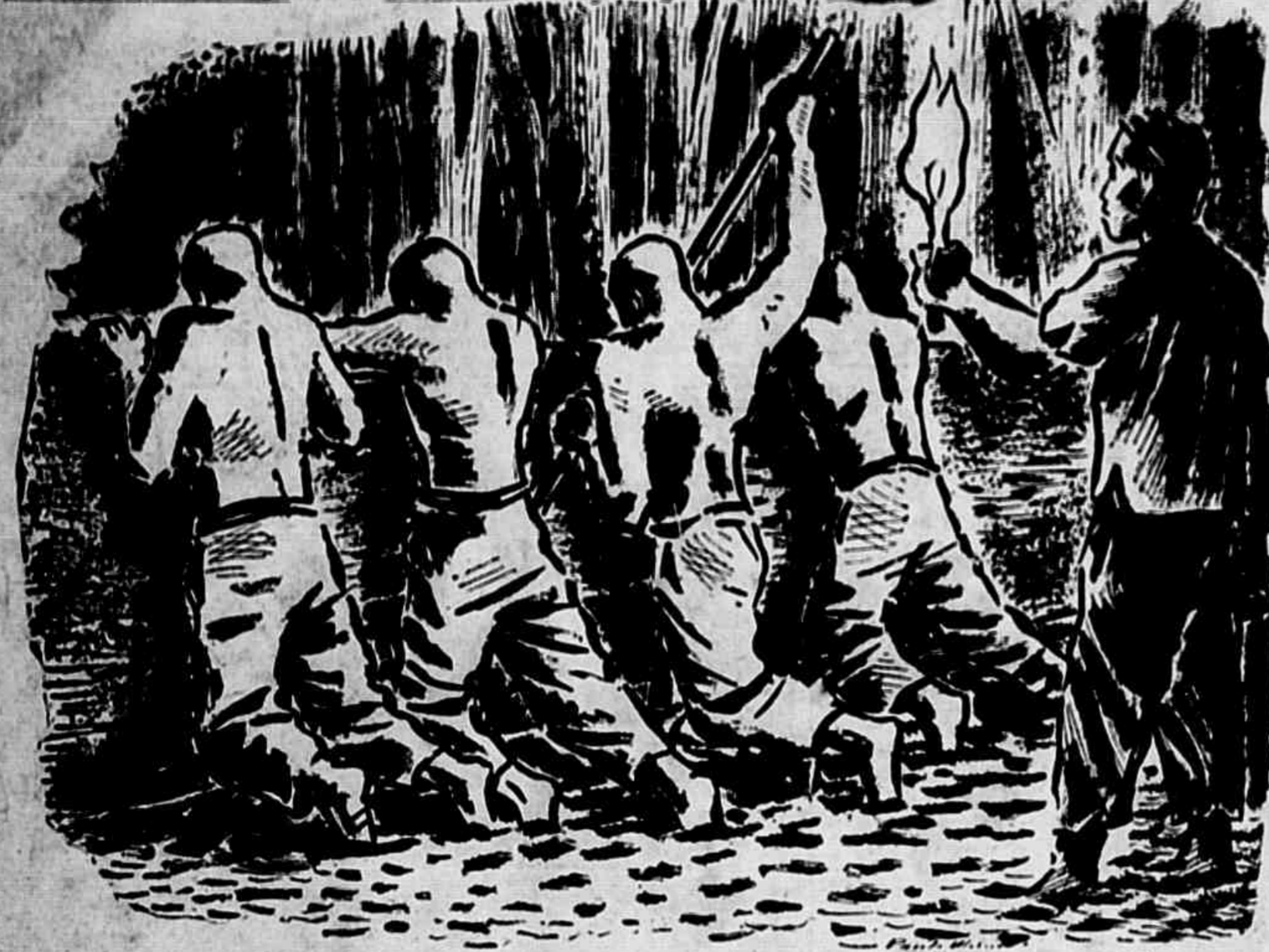
"A' noite, em plena floresta, num tortuoso caminho de lama, iluminados á luz dos archotes, eles trabalham colando madeira."