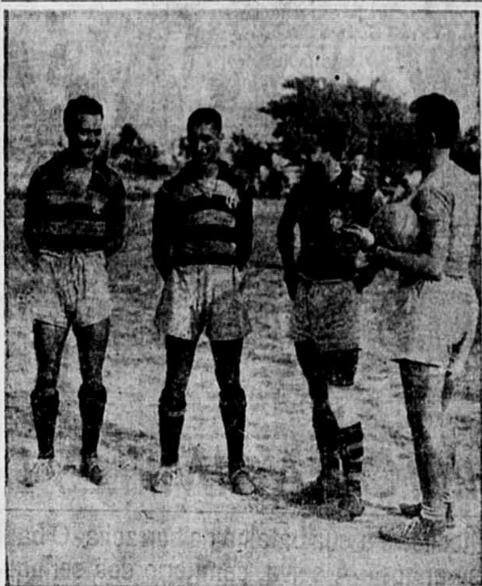
Os rubro-negros, com o seu técnico, antes do ensaio matinal de ontem