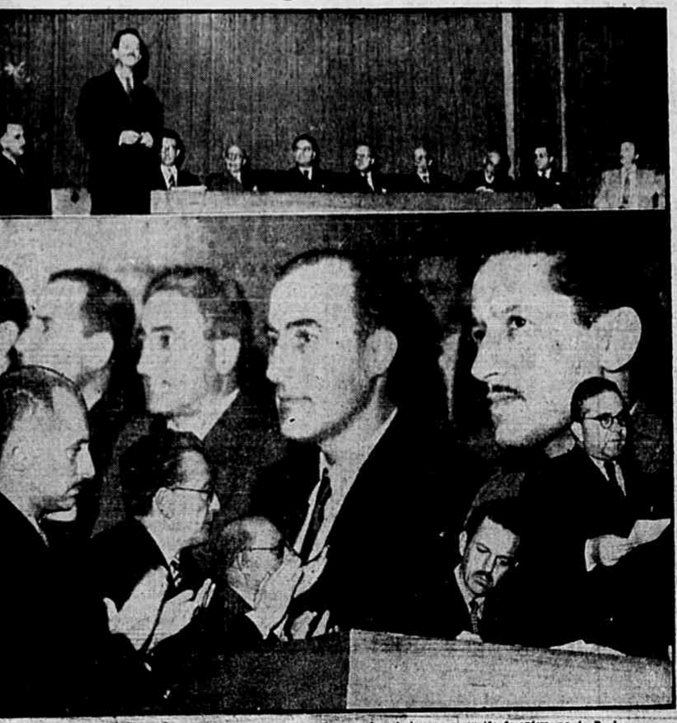
Espanhóis, brasileiros e portugueses anti-fascistas vibraram de entusiasmo na reunião de ontem, na A. B. I.

No edifício da A. B. I., com uma assistência que se chegou a auditorio do 9.º andar, realizou-se ontem à noite a sessão de fundação de uma entidade constituída por brasileiros amigos da Espanha, espanhóis residentes no Brasil e elementos anti-fascistas da colônia portuguesa, com o programa de ajudar os milhares de democratas encarcerados pela ditadura de Franco e solidarizar-se por todos os meios legais com o movimento que dentro e fora da grande nação hispânica visa a eliminação do quisto falangista e a reincorporação da Espanha à grande família democrática de povos, nas bases da organização da segurança coletiva criada pela Conferência de São Francisco.