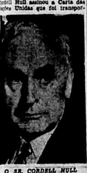
O SR. CORDELL HULL

Importante documento foi transportado de avião para Washington sob rigorosa vigilância