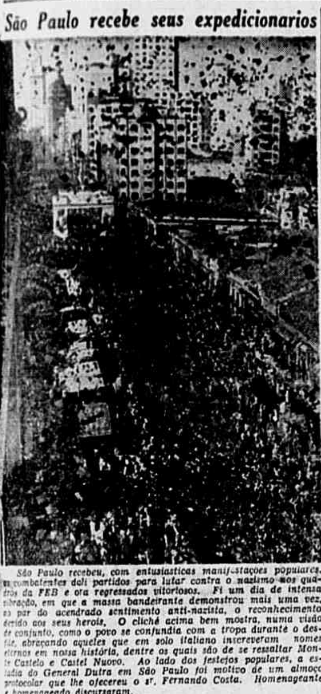
São Paulo recebe seus expedicionarios

Hoje, às 20 horas, na sede da Liga da Defesa Nacional, à Av. Augusto Severo, 4 prosseguirão os trabalhos da Grande Convenção Popular. Reune-se a sua Comissão de Saúde, que apresentará o resultado dos estudos procedidos sobre as inúmeras teses apresentadas ante a Convenção, com relação à matéria de sua especialidade. A mesa que dirigirá os trabalhos faz questão de que todos fiquem clientes serem amplos os debates, tendo por tema o citado relatório; nele podem tomar parte, não só os membros da Comissão de Saúde, senão também podem e devem intervir os delegados das organizações que apresentaram teses como as pessoas que comparecerem a essa reunião plenária, quinta assembleia da Convenção Popular.