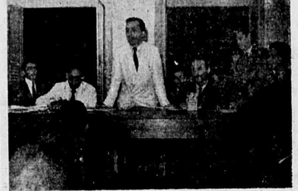
Luiz Carlos Prestes falando aos universitários

BUENOS AIRES, 31 (U. P.) — Por um decreto governamental, foi aceita a vigência do Estatuto do Partido Comunista, sob a condição de que se enquadre nos dispositivos da Constituição. ORGANIZAÇÃO DAS FORÇAS POLITICAS BUENOS AIRES, 31 (U. P.) — A partir de amanhã poderão atuar na Argentina os partidos políticos e para facilidade dos mesmos encara-se a possibilidade do levantamento do Estado de Sitio. O Partido Comunista poderá existir legalmente sempre que acate a constituição. O comunicado divulgado hoje pela Secretaria de Informações, depois de se referir aos aspectos jurídicos que envolvem a questão, afirmou que o objeto de especial estudo é a relativa ao reconhecimento da pre-existência dos partidos políticos de tradição histórica e atuação nacional.