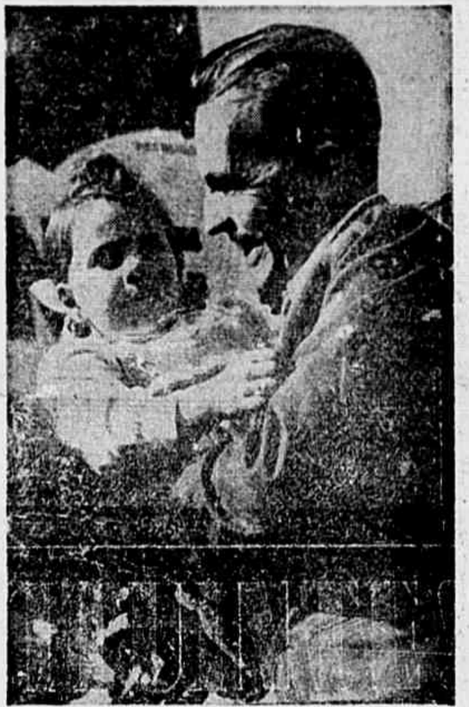
Prestes sustenta em seus braços uma linda criança que lhe ofertou uma bráçola de flores

Centenas de comitês preparatórios foram organizados, diariamente, nos locais de trabalho, nos bairros, nas salas de cinemas e em todos os pontos de concentração, para convidar o povo à festa e explicar o significado da visita do grande filho do Rio Grande ao seu pai no Rio de Janeiro. Centenas de milhares de cartazes-monstros e volantes, centenas de faixas, conferências, palestras radiofônicas, editões extraordinárias do semanário "Libertação", um sergido quase que literalmente todos os muros e letras da rua de Porto Alegre, tudo isso contribuiu para que durante as três semanas de preparativos a atenção política do Rio Grande se concentrasse na próxima visita de Luiz Carlos Prestes. E os comitês populares democráticos, o Movimento Unificado dos Trabalhadores, os Sindicatos, as Comissões de locais de trabalho, os Clubes espor-