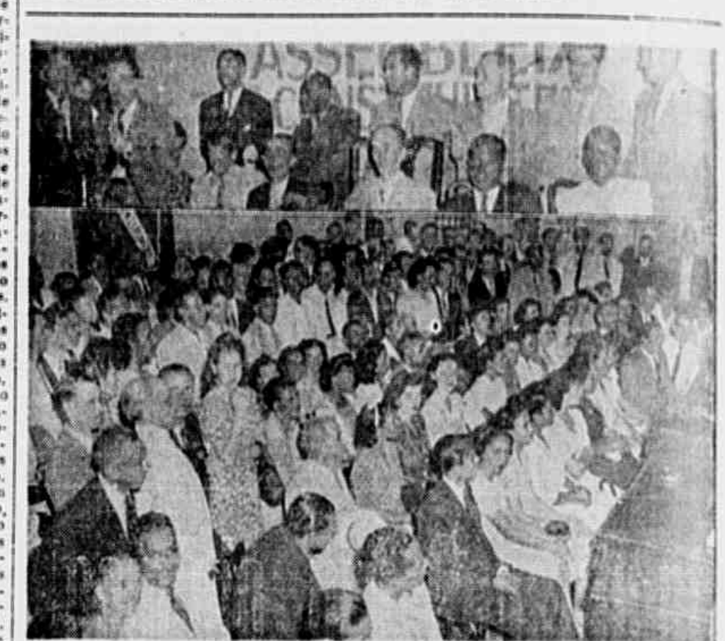
ACIMA, DOIS ASPECTOS da reunião de ontem na qual, os metalúrgicos, numa reunião em que debateram, no terreno econômico, assuntos de seu interesse, manifestaram-se também, mais uma vez, pela reivindicação mais imediata do nosso povo, a convocação da Assembleia Constituinte.