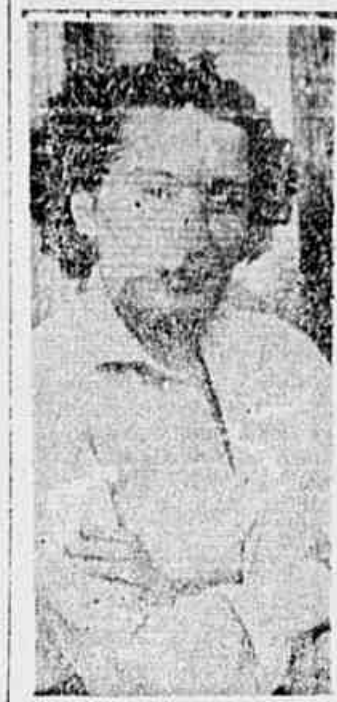
OLGA PRESTES, esposa de Luís Carlos Prestes, assassinada em um campo de concentração nazista.