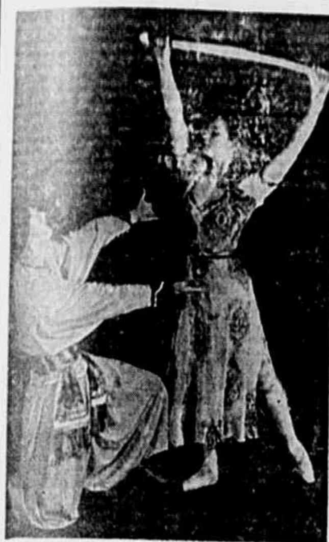
Mavra Demjanova, Premio Stalin, e M. Gabovich, ambos cristas laureadas da República Federal Russa, interpretam o ballet "Juras Salba", produzido pela Academia do Estado do Teatro Bolshoi, de Moscou.

O Teatro de Arte de Moscou... (continuação do texto sobre a escola de interpretação)