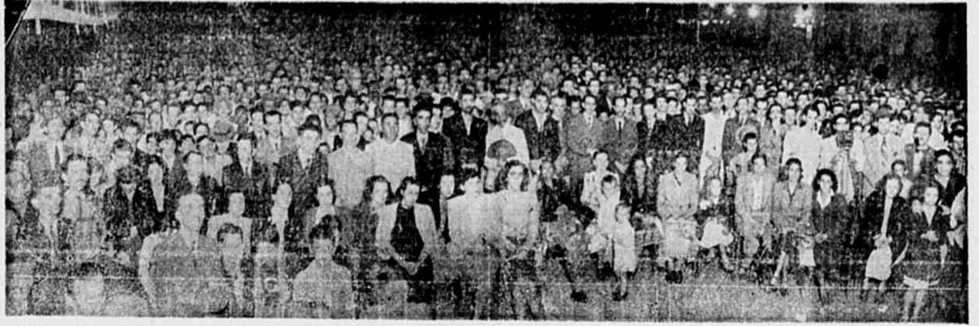
Enorme multidão, em Juiz de Fora, compareceu ao comício, para ouvir a palavra de Luiz Carlos Prestes. Foi a maior demonstração jamais verificada no grande centro industrial de Minas Gerais

"Contra os políticos golpistas e militares 'salvadores' estamos dispostos a apoiar o governo para defender a ordem e a paz, salvando o Brasil da guerra civil" — Nestes últimos seis meses o P. C. tem sido um esteio da ordem em nossa terra — O povo não quer voltar atrás. Quer pensar com sua própria cabeça. E' isso que os reacionários temem e querem evitar