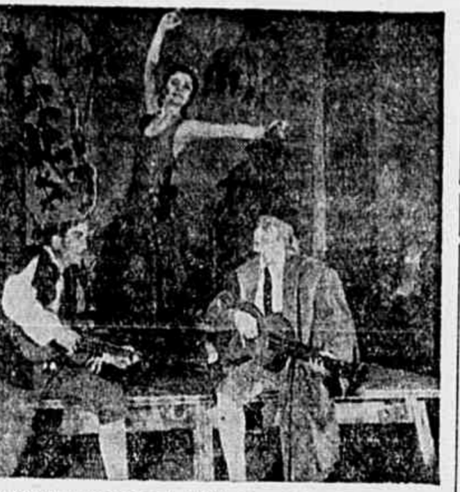
Na Taverna, uma cena do terceiro ato da nova versão do ballet "Don Quixote", aparece no clichê ao alto. A direção do ballet é do artista laureado M. Gabovich e foi ensaiado na Academia do Estado do Teatro da Opera da URSS.

Para bem, em "Catarina Ismailova" se realiza um verdadeiro milagre de renovação artística.