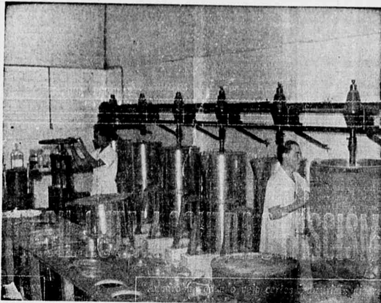
Um aspecto interessante da secção da Bateria de Extratores

Mas, enquanto essas necessidades não se tornam realidade, os industriais vão tomando iniciativas por conta própria. Durante a guerra a indústria nacional cumpriu sua tarefa no esmagamento do fascismo. Patrões, trabalhadores, todos deram de seus esforços para que