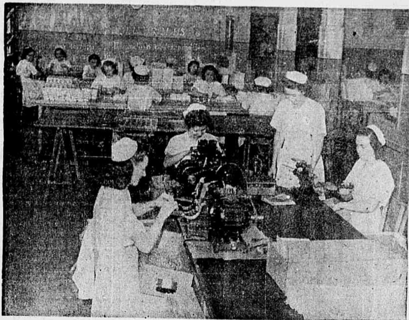
Neste clichê vemos nossas auxiliares na Secção de Acondicionamento

— No fim de cada ano fazemos uma festa de confraternização em que, um dos diretores faz uma palestra sobre as atividades da empresa. Assim interessamos os funcionários no progresso da empresa.