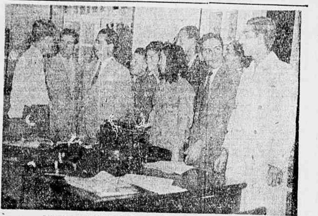
Dirigentes e associados do Rio Comprido F. C., em visita à nossa redação