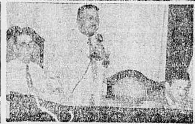
Quando falava o presidente do sindicato da Light

Anunciou-se, sem confirmação, que o coronel Peron regressou, por avião, ontem à noite, de Chuivi e que, durante a maior parte da noite e esta manhã, dedicou-se às negociações para a