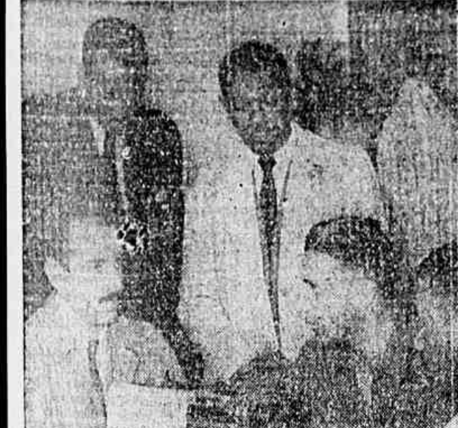
Membros da diretoria da Escola de Samba "Catretas de Santana", falando ao nosso redator

Em grande atividade os meios carnavalescos da cidade ★ Para festejos de Momo ★ Visita nossa redação a Escola de Samba "Catretas de Santana" ★ Homenagem aos deputados do P. C. B.