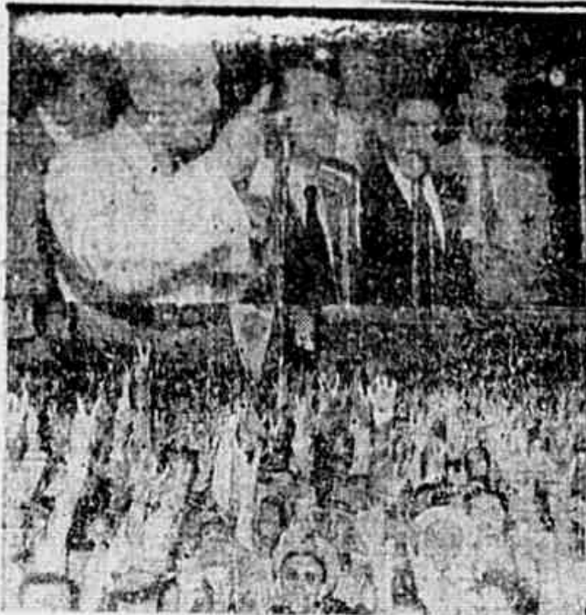
NA VELHA CIDADE DO SALVADOR, de gloriosas tradições nas lutas pela Democracia, a candidatura de União Nacional caiu em terreno propício. Cantada dos políticos do passado, que tudo prometem nas vésperas de eleições, a Bahia vem agora se para ultrapassar nas urnas o nome do engenheiro Yeddo Fiuza e dos legítimos representantes do povo. O clichê fixa dois aspectos da visita de Fiuza e do líder nacional Luís Carlos Prestes. Ao alto: o líder Eugênio Lorigne, espírito, falando ao povo. Em baixo: parte da multidão no Largo da Sé

Em todas as capitais e cidades do Brasil por onde tem passado a caravana de Prestes e Fiuza, o povo a tem recebido com as mais estrondosas manifestações. Em São Paulo, 300 mil pessoas reuniram-se no Vale de Anhangabaú; em Porto Alegre, 30 mil democratas aclamaram o Candidato do Povo, na Bahia 70 mil homens do povo, em Recife, 250 mil; quase toda a população da capital, em Belo Horizonte 70 mil, em Campos 15