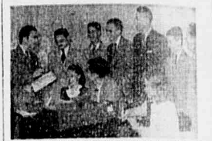
O corpo redatorial do "O Jornal da Juventude", em sessão de trabalho.

O novo órgão lutará na defesa dos Direitos e das Reivindicações da mocidade - Constituídas diversas comissões