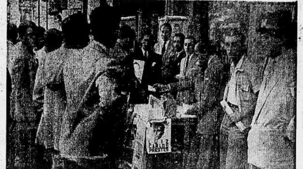
A CIDADANIA APRESENTAVA ONTEM UM NOVO ASPECTO AO TRANSEUNTE. — A distribuição de cédulas para as eleições de hoje, já intensificada em uma emulação democrática, atingiu ao máximo, empenhando-se todos os partidos políticos em uma propaganda eleitoral generalizada, para a qual lançaram mão dos mais variados meios, mobilizando para esse trabalho numerosas equipes que se rezearam. Para esse fim achavam-se ontem instaladas na Avenida Rio Branco, Cincinédia e imediações, grande número de bancas, sendo enorme o movimento em redor das mesmas, procuradas que eram por pessoas que escolhiam chapas de diversos partidos e selecionavam os candidatos de sua preferência. Particularmente nas bancas do Partido Comunista do Brasil era intenso o movimento, onde além da distribuição de cédulas, eram vendidos escudos, selos do P.C.B. e retratos de Prestes e do candidato de União Nacional, Yeddo Fiuza.