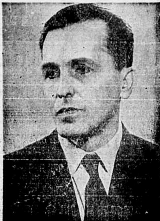
Luiz Carlos Prestes