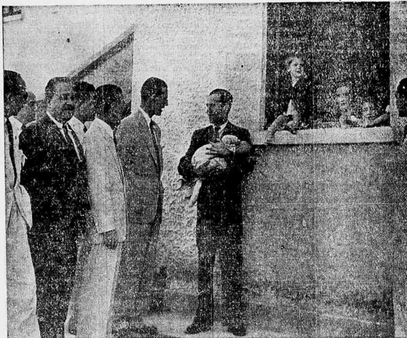
O presidente do I.A.P.C., em companhia de autoridades, jornalistas e pessoas gradadas, palestra com um dos primeiros moradores do bairro dos comerciantes, no dia de sua inauguração