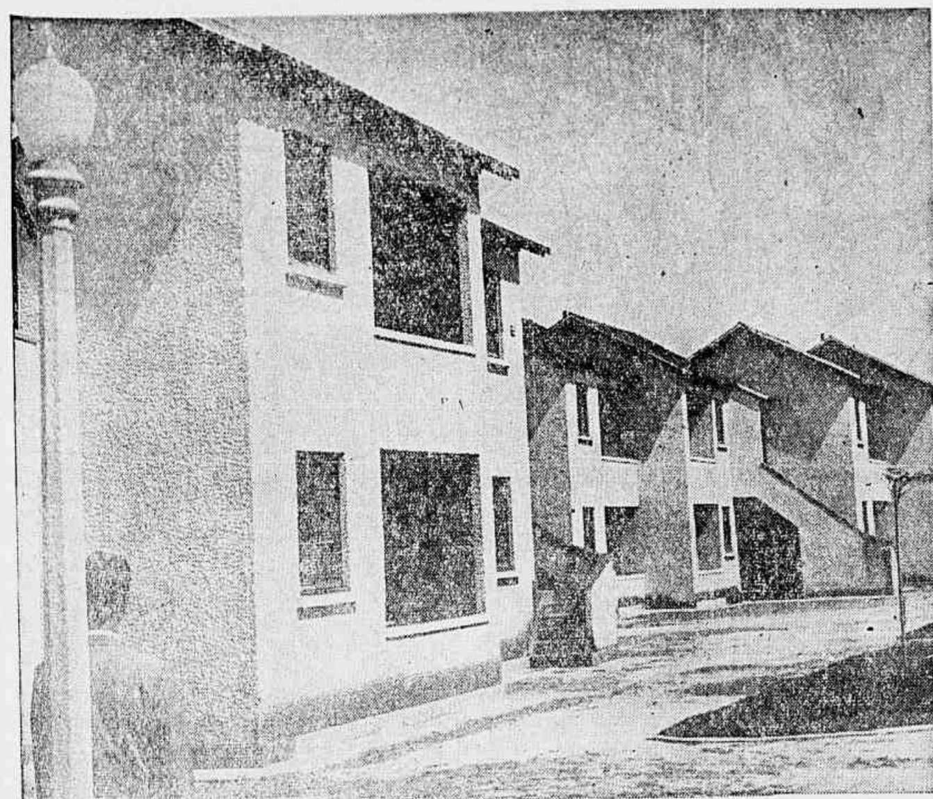
Um outro aspecto das residências já entregues aos associados do I.A.P.C.