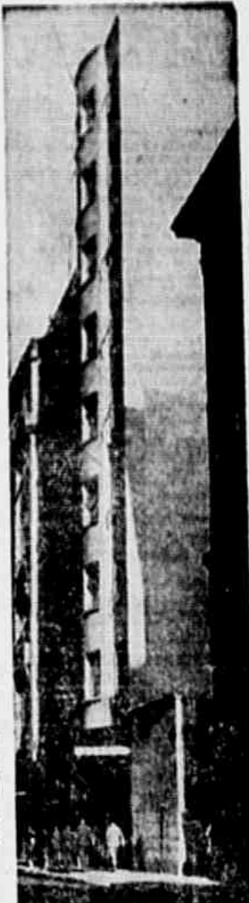
O edifício de 10 andares, da rua Alcindo Guanabara, com capacidade para atender 800 consultantes do Instituto dos Comerciantes

Referindo-se às construções de casas próprias, o presidente do I.A.P.C., disse: "Emprestou, ainda, o Instituto dos Comerciantes, a associados seus, para construção ou aquisição de casa própria, quarenta e seis milhões duzentos e setenta e sete mil quinhentos e vinte e dois cruzeiros (Cr$ 46.277.522,80) a saber: — no Distrito Federal, treze milhões setecentos e setenta e oito mil e novecentos cruzeiros e setenta centavos (Cr$ 13.778.900,70); em São Paulo, dezesseis milhões cento e vinte e cinco mil trezentos e sessenta e quatro cruzeiros e sessenta centavos (Cr$ 16.125.364,60); em Minas Gerais, dez milhões duzentos e cinquenta e quatro mil novecentos e sessenta e sete cruzeiros e quarenta centavos (Cr$ ..... 10.254.967,40); em Pernambuco, três milhões cento e oitenta e três mil duzentos e noventa cruzeiros e dez centavos (Cr$ ..... 3.183.290,10); no Rio Grande do Sul, dois milhões trezentos e dezoito mil e quinhentos cruzeiros (Cr$ ..... 2.318.500,00); no Paraná,