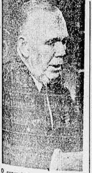
O general George Marshall é o novo embaixador dos Estados Unidos na China, arrecebe na J.ª Comissão Especial de Inquérito do Senador de Pearl Harbor, Af.

Primeira reivindicação de caráter urgente: abastecimento da água para a população carioca ★ Rememorando as teses da Convenção Popular do Distrito Federal, realizada este ano pela L.D.N. ★ Fala á "Tribuna Popular" o maestro Vila-Lobos