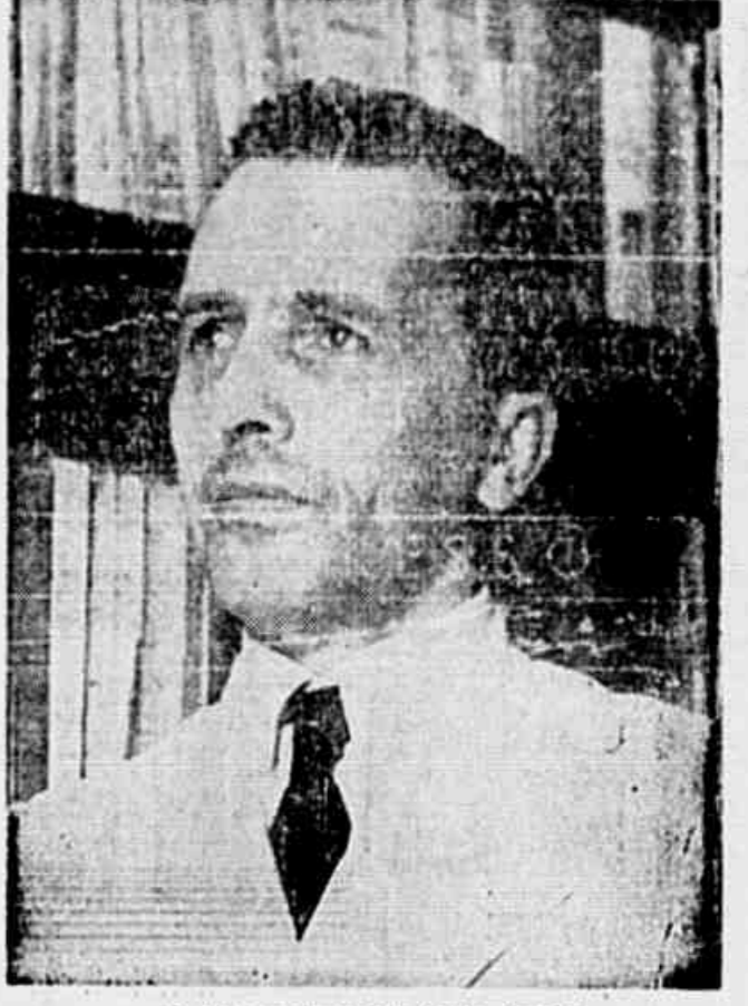
O líder nacional Luiz Carlos Prestes

Luiz Carlos Prestes, Secretário Geral do P. C. B., deu ontem uma entrevista à "Tribuna Popular" em que reafirmou a posição do seu Partido na luta pela união nacional e defesa da ordem e da tranquilidade interna. E está a entrevista que também contém importantes declarações sobre as eleições e o movimento político, que passamos a transcrever: — Na próxima reunião do Comitê Nacional do P. C. B., faremos um balanço crítico da campanha eleitoral. Temos a impressão de que esta constitui, em geral, uma grande vitória para nós. Os resultados estão perfeitamente dentro dos nossos cálculos. Em contato com as grandes massas, conhecendo todas as deficiências do alistamento, sabendo que a maioria dos operários e camponeses é analfabeta e, portanto, não tinha o direito de voto, não podíamos esperar mais do que os números estão revelando. Além disso, o P. C. B. mal tem 6 meses de vida legal. Seus recursos de propaganda, tais como, principalmente, o rádio e a imprensa, são ainda reduzidos e precários. Se, em certos momentos, a nossa propaganda parecia maior que a dos adversários, isto se deve, sobretudo, à iniciativa das grandes massas e à dedicação exemplar dos comunistas. E depois de outras considerações, fez o seguinte ponto da entrevista, afirmando que a votação obtida em todo o país pelo P. C. B., que alcançou expressivos algarismos, sobretudo em Santos, Natal, Aracaju, São Paulo (capital), Recife e Porto Alegre, está correspondendo à sua expectativa.