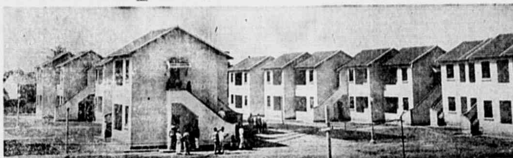
Um aspecto do bairro residencial dos comerciantes em Olaria

Foram três zonas escolhidas para as primeiras instalações de assistência social aos comerciantes nesta capital. A primeira instalação em edifício de dez andares, no centro da cidade, à rua Alcindo Guanabara n. 20, com quarenta e seis médicos de clínicas especializadas e capacidade para atender a cerca de seiscentos consultantes por dia. A segunda, em Botafogo, sito à rua Voluntários da Pátria, também em edifício próprio de dez andares, dispõe de quatorze médicos e tem capacidade para