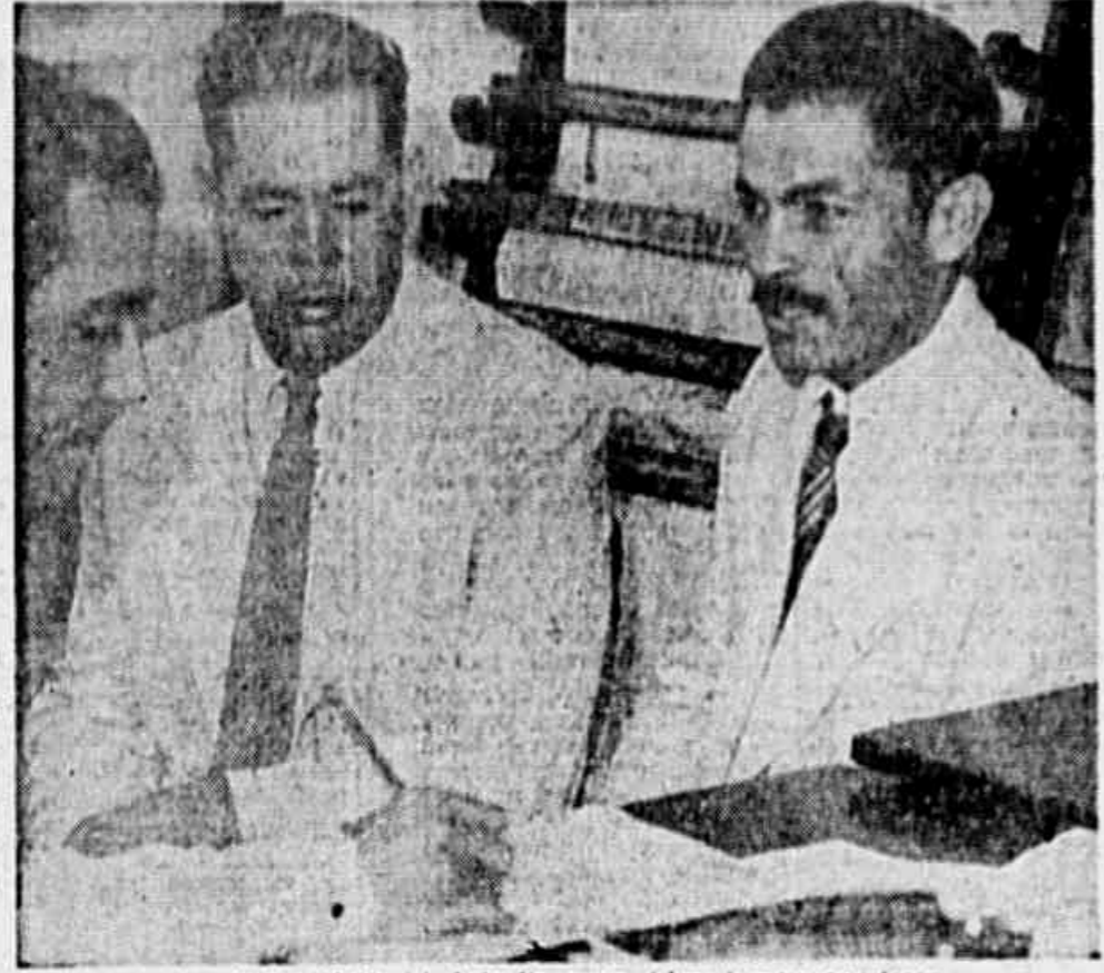
Dirigentes do Comitê Municipal de Itaperuna, falam à nossa reportagem.

ANO I ☆ N.º 179 ☆ Av. Aparício Borges, 207-13.ª ☆ Quarta-feira, 19.12.1945