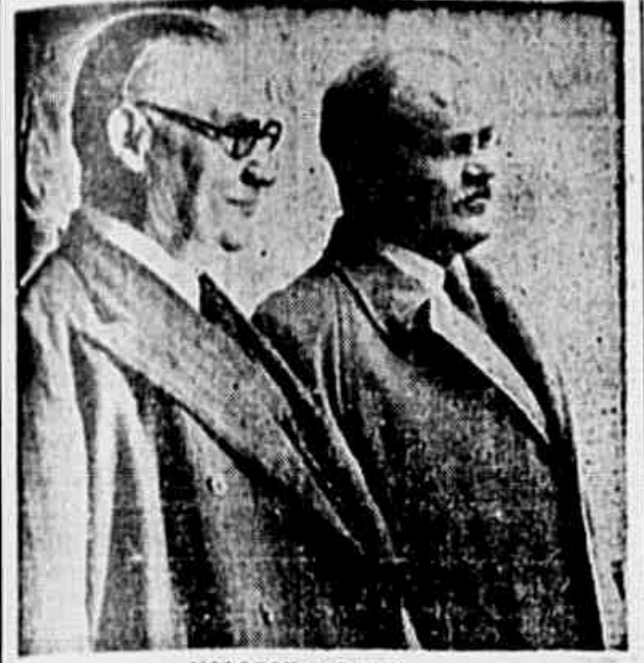
MOLOTOV e BEVIN