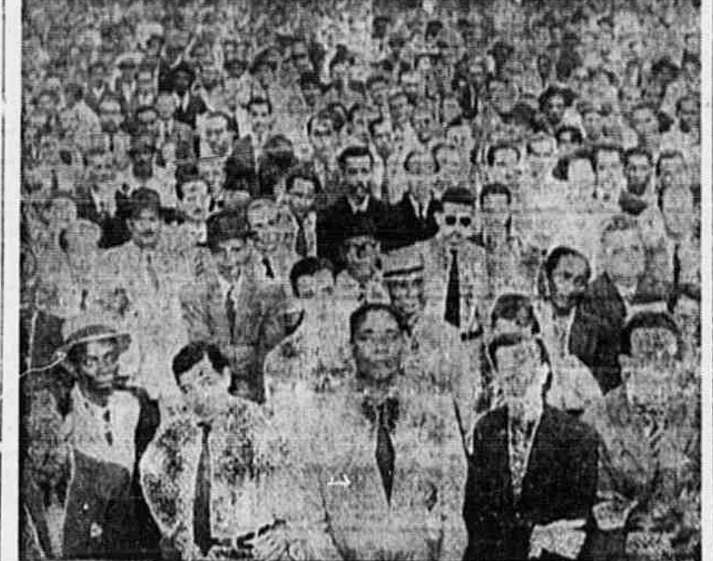
Aspecto parcial da Assinância, dada no o comício pró-autonomia.

(CONCLUSÃO DA 1ª PAG.) nha, durante a Guerra Civil, com honrosas e ilustres exceções. Acha o sr. Girat que a questão da participação da Igreja na educação deverá ser sujeita previamente à Corte, sob pena de qualquer resolução sobre o ensino religioso nas escolas primárias e secundárias.