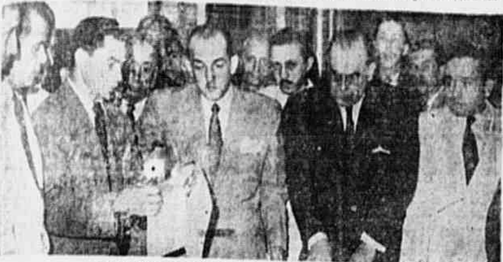
Aspecto da reunião na Comissão de Marinha Mercante