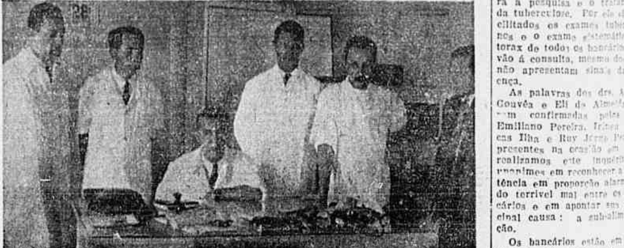
Um grupo de médicos dos bancários, falando à nossa reportagem

mente 260 bancários. Com o movimento de assessoria e bem das práticas médicas orgânicas em que se encontra a classe. As apresentações de tuberculose vão a uma taxa de 35 mensalmente. O Instituto — acrescenta — fornece amplos recursos para a pesquisa e o tratamento da tuberculose. Por esse motivo, os exames laboratoriais e o exame clínico torax de todos os bancários vão à consulta, mesmo dos que não apresentam sinais de doença.