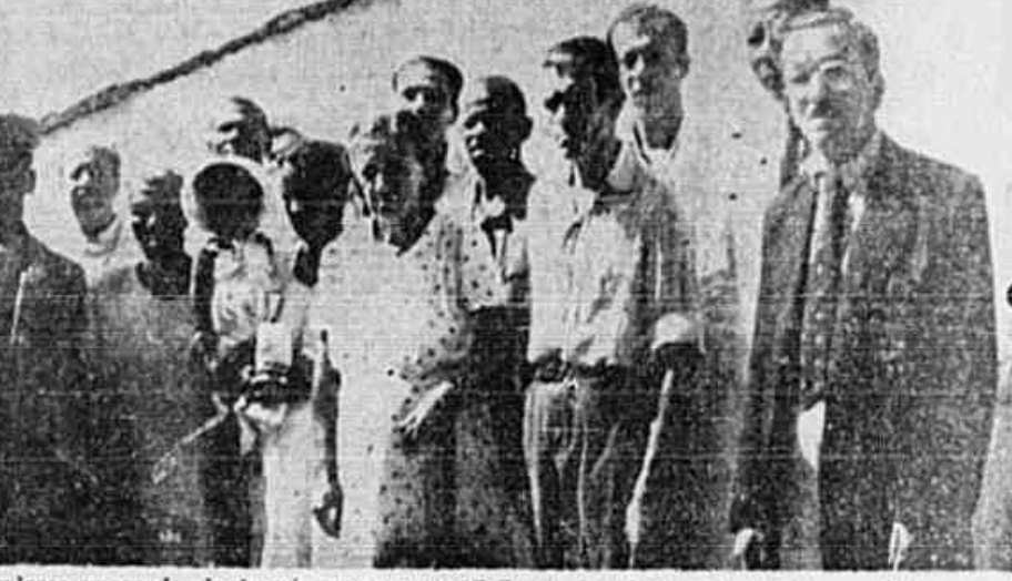
Populares ameaçados de despejo, posam para "Tribuna Popular", em Niterói.