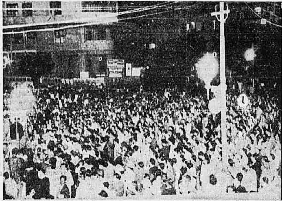
Um aspecto do comício anti-fascista realizado em Belo Horizonte

LONDRES, 31 (U. P.) — Anunciou-se que o "Centro Britânico contra o Imperialismo", formado antes de 1939, mas suspenso durante a guerra, está sendo restabelecido em linhas mais amplas, enquanto "centros" similares são constituídos na Holanda, França e Estados Unidos. O Centro Holandês incluiu socialistas de esquerda — grupo dissidente do Partido Social Democrático — e o indonésio, enquanto o francês incluiu indochineses. Harold Lank, Michael Foot e outros membros trabalhistas do Parlamento britânico falaram na cerimônia de reabertura do Centro Anti-Imperialista da Grã Bretanha, a 23 e 24 de fevereiro.