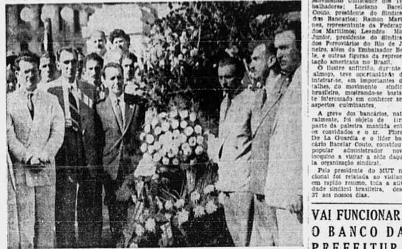
NA SALA DE TIRADENTES, O P. C. B., por sua tarefa de na Assembleia Constituinte, homenagem ao martir da independência. Teve lugar esta cerimônia depois da sessão ontem realizada no edifício da Câmara, na qual os comunistas se levantaram em defesa da soberania do Parlamento e do direito de greve.

O Sr. Florio de La Guardia, ex-prefeito de N. York e grande animador do programa social do saudoso presidente Roosevelt, mostrando-se desejoso de ter um contacto mais directo com os verdadeiros dirigentes proletários do Brasil, endereçou a alguns líderes sindicais brasileiros um honroso convite para um almoço na Embaixada Americana, onde o illustre hospede de nosso país teve a oportunidade de pastrar sobre as actividades trabalhistas brasileiras.