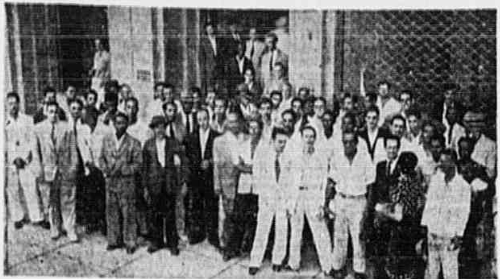
A comissão de trabalhadores em reunião, quando em nossa redação

A luta operária está em sua véspera. É hora de preparar o terreno para a vitória final. Não se deixe enganar por falsas promessas de paz social. A luta continua até a conquista dos direitos fundamentais.