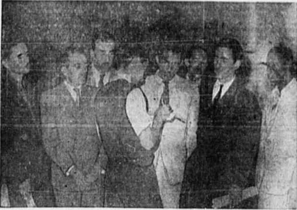
OS MARMORISTAS ESTÃO LUTANDO há cinco meses por melhores salários. Esta luta começou em 26 de outubro de 1945, sendo utilizados todos os recursos pacíficos e legais...

ANO II N.º 255 QUINTA-FEIRA, 21 de MARÇO DE 1946